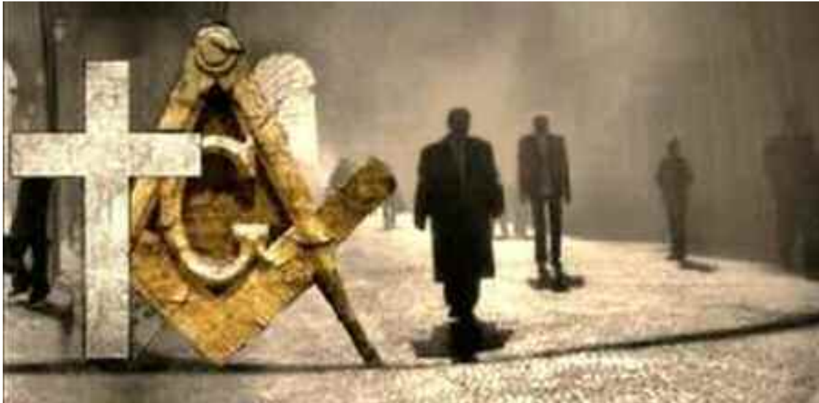
La tragedia della Chiesa cattolica: dei “falsari” si sono impadroniti del simbolo della croce!

I l colpo di stato globale, che è scattato nel marzo del 2020 e che da quasi due anni ci tiene sotto scacco, spogliati dei nostri diritti fondamentali, persino quello di uscir di casa o di avere un funerale decente, e al quale la maggior parte di noi ha dato più o meno tacitamente il proprio consenso, è solo l'ultimo anello di una catena da schiavi che da anni e decenni era stata forgiata e ci era stata messa ai polsi e alle caviglie; una catena che non avevamo percepito perché era tenuta dai nostri carcerieri talmente lenta, e perché era così ben dissimulata, da sfuggire alla consapevolezza di quasi tutti.