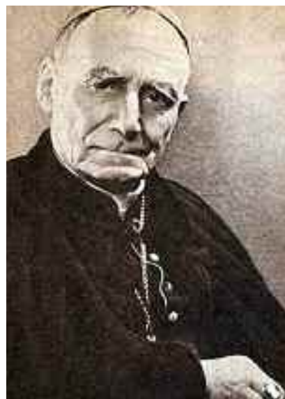
Card. José Maria Caro y Rodriguez, Primo Cardinale di Santiago, Cile (1939-1958).

«Dal 1821, tutti i piani e le agitazioni rivoluzionarie di cui