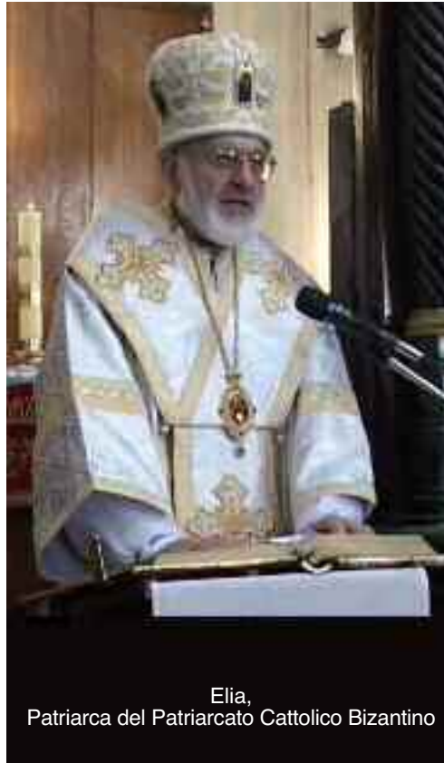
Elia, Patriarca del Patriarcato Cattolico Bizantino