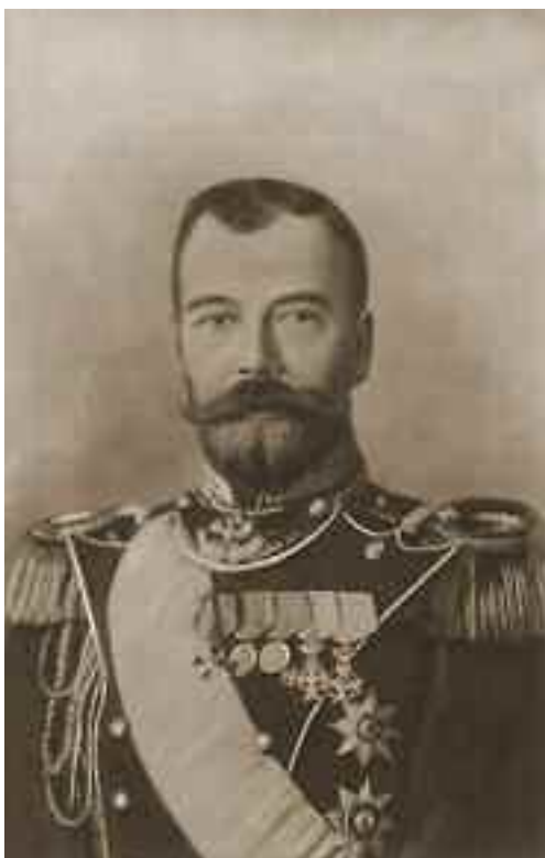
Lo zar di Russia Nicola II Romanov.