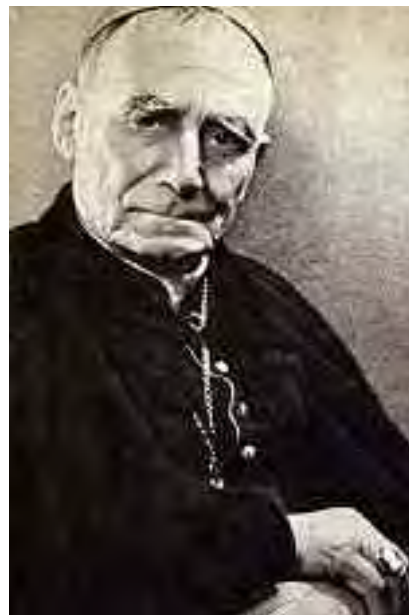
Card. José Maria Caro y Rodriguez, Primo Cardinale di Santiago, Cile (1939-1958).

In conformità a tali dottrine morali, Adriano Lemmi, in un discorso segreto, disse che egli si prendeva vantaggio delle circostanze per ripetere che: « I mezzi sono legittimi quando consentono ai Fratelli di raccogliere soldi per la loro propaganda ». Quello che non sempre viene detto, con tutta la crudezza e la chiarezza nella dichiarazione sopra riportata e in altre che ho ommesso per brevità, è ciò che viene inculcato agli iniziati in modi altrettanto efficaci: « In tutte le Istituzioni Massoniche all'iniziato viene insegnato, sin dai primi gradi, che egli non deve mai, in nessuna circostanza o per qualsiasi pretesto, rivelare nulla di ciò che egli ha visto e ascoltato, o di quello che egli vedrà o udirà nelle logge; gli viene anche detto che egli non è legato da alcun suo previo dovere o incarico che sia contrario ai suoi nuovi doveri di massone. Gli viene inoltre implicitamente detto che egli sarà obbligato a compiere ciò che è ingiusto oppure di violare anche i suoi obblighi sacri. »