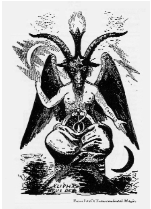
Il Baphomet. Il "dio" della Massoneria.

Ora, se ordiniamo tutta questa simbologia, in senso gerarchico massonico, in campo temporale, si ottiene: