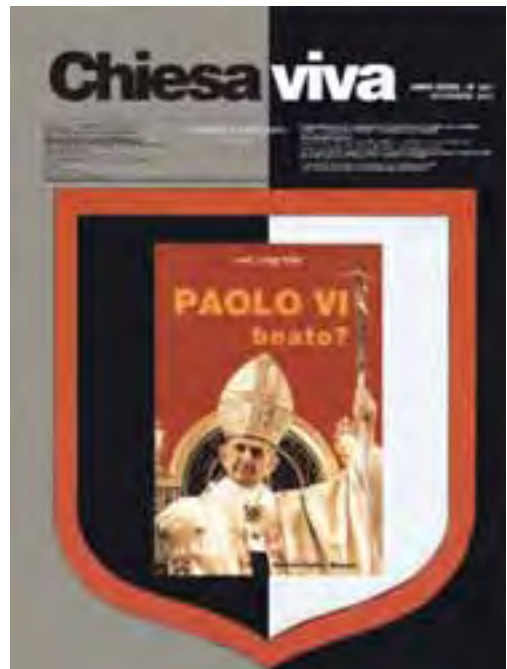
Copertina di “Chiesa viva” n. 421.

16° grado: «Il Culto del nuovo Tempio: la Repubblica massonica universale si deve fondare sullo Stato multi-etnico e inter-religioso ».