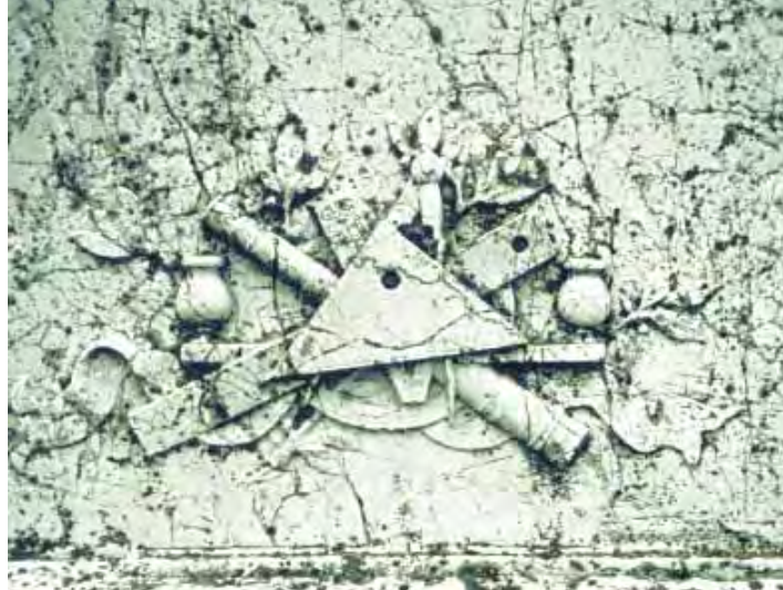
Particolare del tombale della famiglia Alghisi (la famiglia della madre di Paolo VI) nel cimitero di Verolavecchia (BS). Alla base del tombale, in bassorilievo, spiccano questi simboli massonici .

Particolare della formella originale N°12 delle “porte di bronzo” della Basilica di San Pietro (realizzate in occasione dell'80° compleanno di Paolo VI), raffigurante Paolo VI con la “Stella a 5 punte” (simbolo per antonomasia della Massoneria e da noi evidenziata in rosso), incisa sul dorso della Sua mano sinistra.