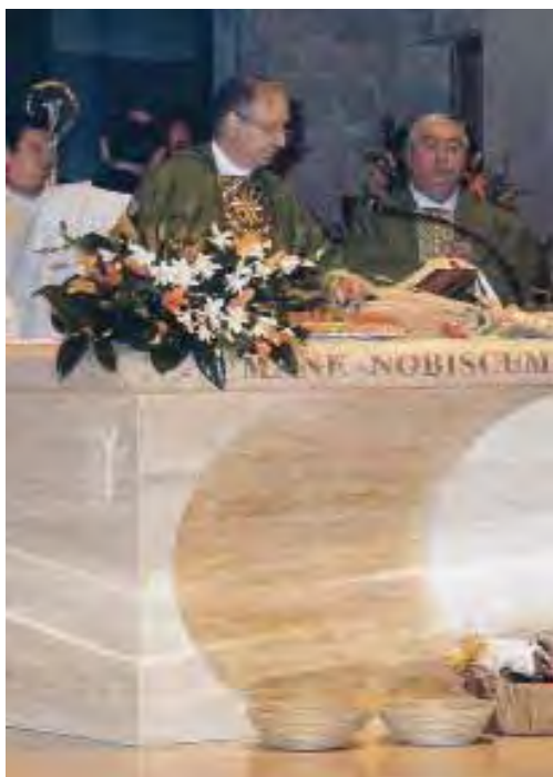
Mons. Luciano Monari mentre celebra la Messa nel Tempio satanico di Padergnone.

sone di Chiavari (che fu cacciato dalla diocesi proprio per un intervento di don Villa, che denunciò la sua appartenenza alla Massoneria), poi la prova, per averlo saputo direttamente da una fonte autorevole in campo massonico . Il Vescovo non reagì, ma, si precipitò in un'altra stanza per far sbollire la sua ira, tornando, poi, ricomposto, per continuare la conversazione, dopo aver cambiato discorso!