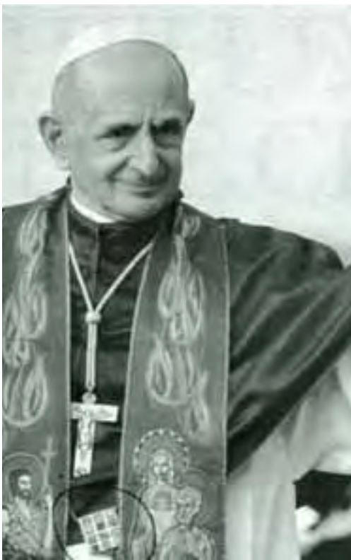
Una delle tante fotografie di Paolo VI che indossa l'Ephod, il monile che Caifa indossava quando condannò a morte Gesù Cristo.

Non si può certo dare dell'incompetente a chi ha progettato questo monumento! Anzi costui, o costoro, dovevano conoscere molto bene Paolo VI e gli aspetti cruciali e profondi della sua opera di demolizione della Chiesa cattolica e della Civiltà cristiana!