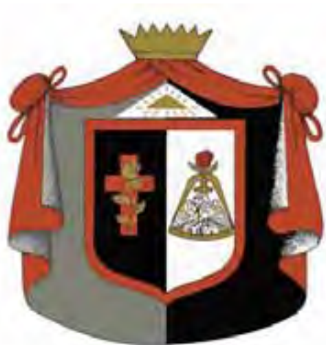
Emblema araldico del 18° grado.

Non posso credere che Lei non sia riuscito a comprendere questo punto!