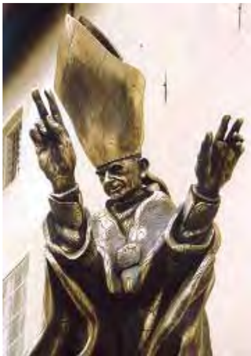
Particolare del Monumento a Paolo VI che mostra il monile a forma quadra sul petto.

Ma vi è un altro aspetto che ci interessa in modo particolare, in relazione al Tempio satanico di Padergnone : il monumento rappresenta Paolo VI con un monile di forma quadra sul petto che è stato inequivocabilmente identificato con l'Ephod, il monile che il Sommo Sacerdote ebreo, Caifa, indossava quando condannò a morte Gesù Cristo!