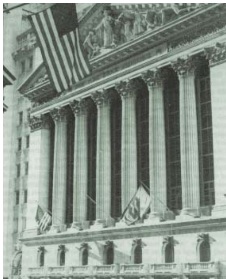
Wall Street. La Bolsa de New York.

El “control” de la emisión de los billetes de papel-moneda, símbolo de costo nulo, realizado por los bancos, ha hecho así posible una “estrategia” de dominación de todos los Mercados, con la consecuencia de haber sustraído