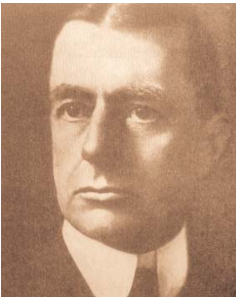
El banquero de Wall Street, Jacob Schiff, amigo de los Rothschild, fue el máximo financiador de la Revolución Rusa de 1917.

Hasta el Primer Conflicto mundial, los “Amos de la Moneda” identificaron sus propios intereses con los del Imperio Británico , para luego abandonarlo, sin cesar de explotarlo. De este modo, lo habían hecho precedentemente con los Imperios Habsburgo y Ruso-zarista, como también con Francia, y como también hoy se aprestan a hacer, pensamos nosotros, en el arco de una (o dos) generaciones, con USA .