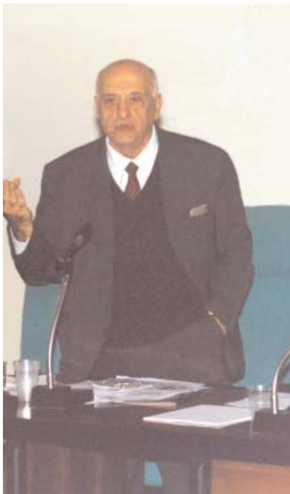
El prof. Giacinto Auriti.

Observemos que en la actualidad, en todos los Estados modernos, los ciudadanos, representados por el Ministro de Hacienda, se adeudan con respecto a la Banca Emisora por toda la moneda que la Banca emite en el mercado (tanto es así que dicha suma, la Banca la carga al Estado).