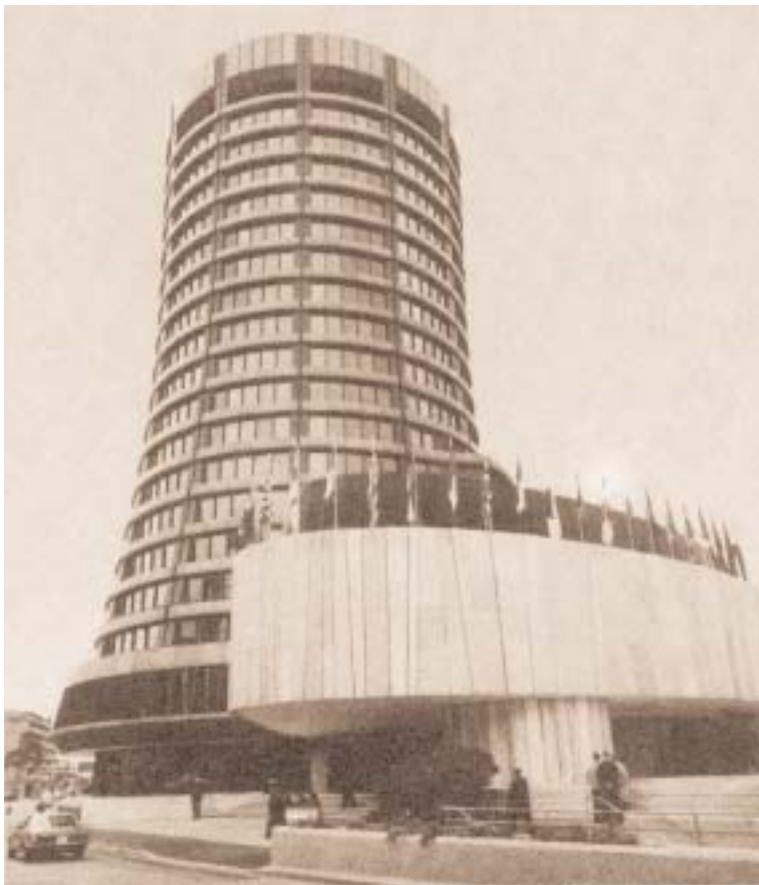
La Banca de los Pagos Internacionales de Ginebra, fundada en 1924

La realización de este “instrumento de dominación” ha sido posible mediante el “monopolio cultural” de la