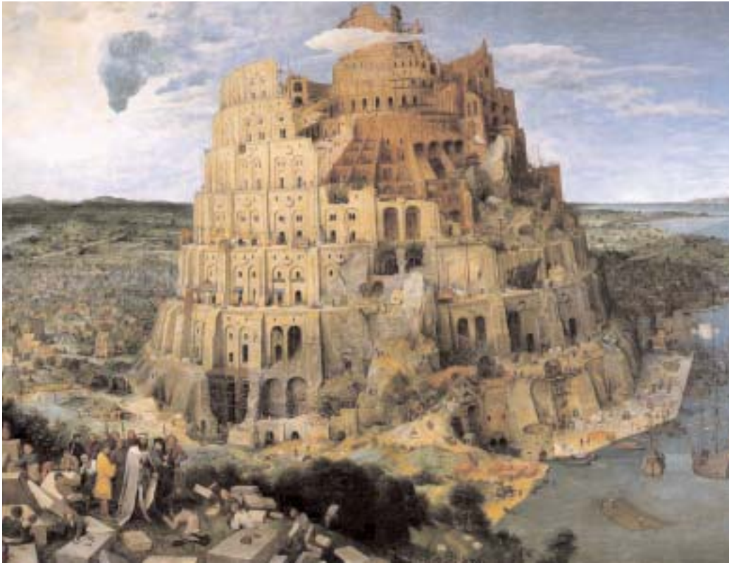
La Torre de Babel. El Nuevo Gobierno mundial no es más que la Nueva Torre de Babel querida por el poder oculto para obtener el aniquilamiento total de la Iglesia de Cristo

ghetto americano en cuanto separaba hebreos de americanos y, sucesivamente, como “revancha”, de allí ha surgido el mayor Templo del dinero y la City (Londres) a través de las distintas Foundation (de los Ford , los Carnegie , los Rockefeller , etc.) “alimentan” con “inagotables” “ríos” de oro la “máquina” que mantiene en pie el gigantesco engaño.