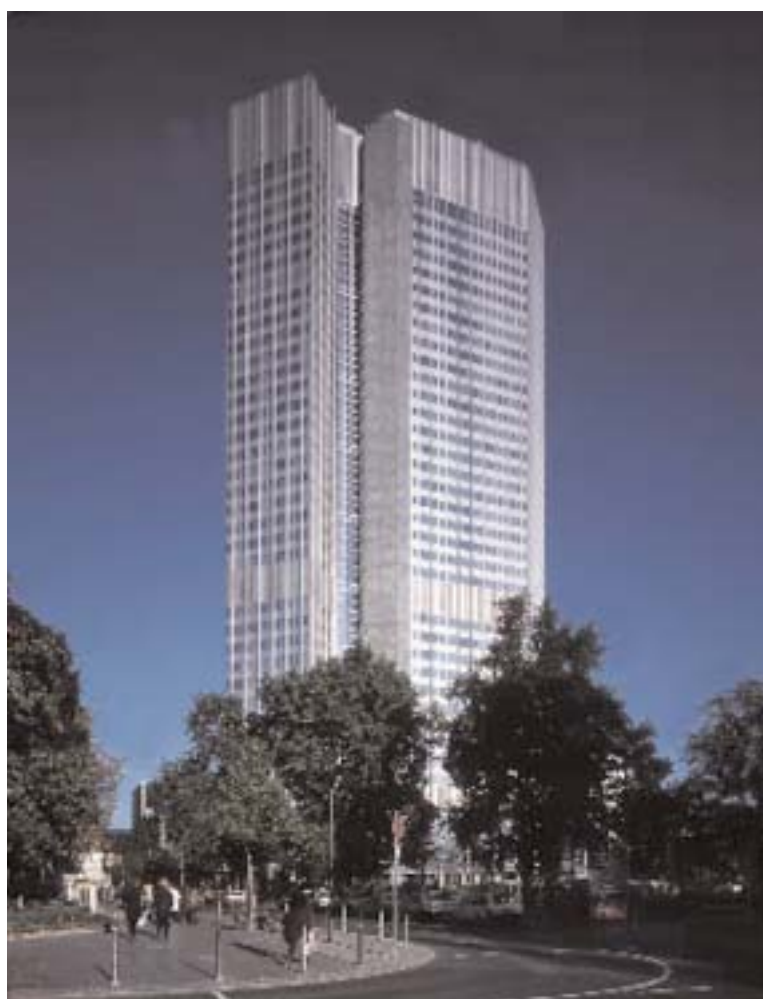
La Banca Central Europea de Francoforte.

(Reginald Mc Kenna, Miembro de la Cámara de los Comunes. Discurso al Midland Bank en enero de 1924).