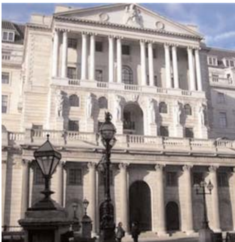
La Banca de Inglaterra fundada en 1694.

El Mamrè muy pronto se difundió también fuera de los confines del Estado de Israel, puesto que los comerciantes extranjeros estaban dispuestos a aceptar estos “símbolos” monetarios en lugar de las monedas de oro; por dos fundamentales motivos: porque evitaban a los mismos comerciantes ser saqueados y porque tenían, en el símbolo, la “máxima” confianza, en cuanto el “recibo” de pago emitido por un único hebreo estaba garantizado sólida-