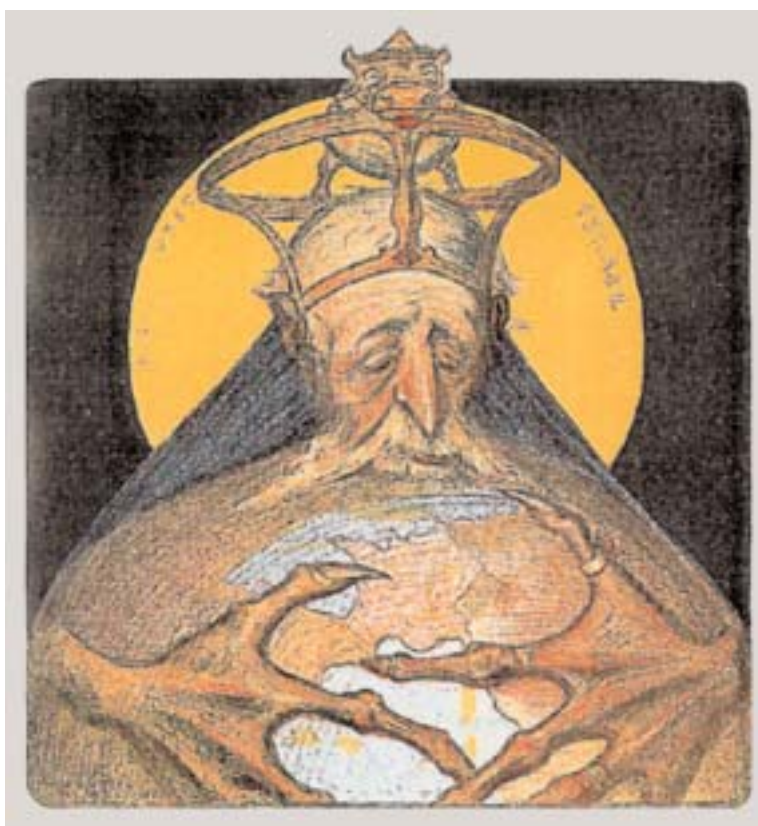
“Rothschild” en una viñeta de C. Léandre – Francia 1898.

El Lema del 31° grado es: “ Justicia y equidad ”.