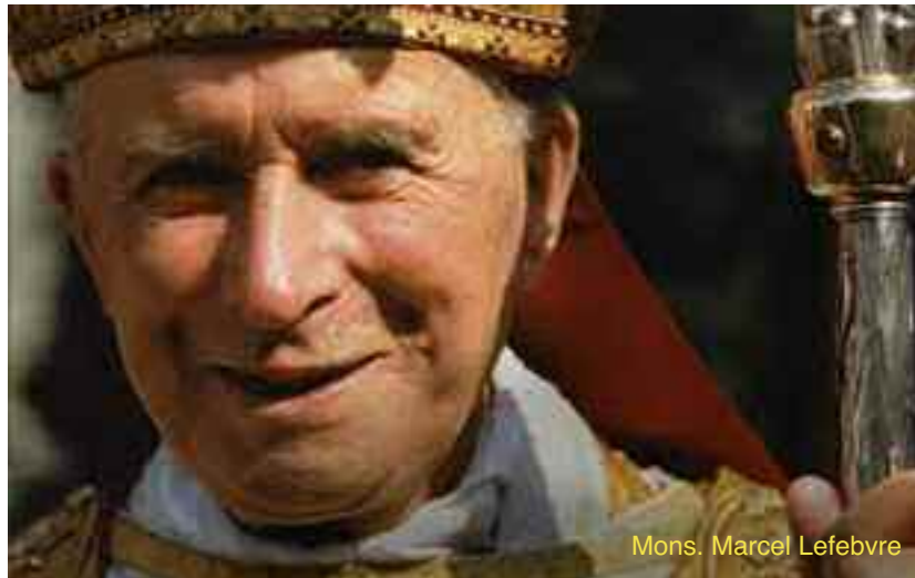
Mons. Marcel Lefebvre

T radidi et quod accepi: Vi ho trasmesso soltanto ciò che avevo ricevuto. Sono le parole che si possono leggere, incise su una tomba presso il seminario di Ecône, nella Svizzera francese: il seminario appartiene alla Fraternità sacerdotale san Pio X, fondato nel 1971; la tomba è quella dell'arcivescovo cattolico Marcel Lefebvre , il più risoluto oppositore delle innovazioni dottrinali e liturgiche introdotte dal Concilio Vaticano II, opposizione che gli valse, nel 1988, la scomunica da parte del pontefice Giovanni Paolo II.