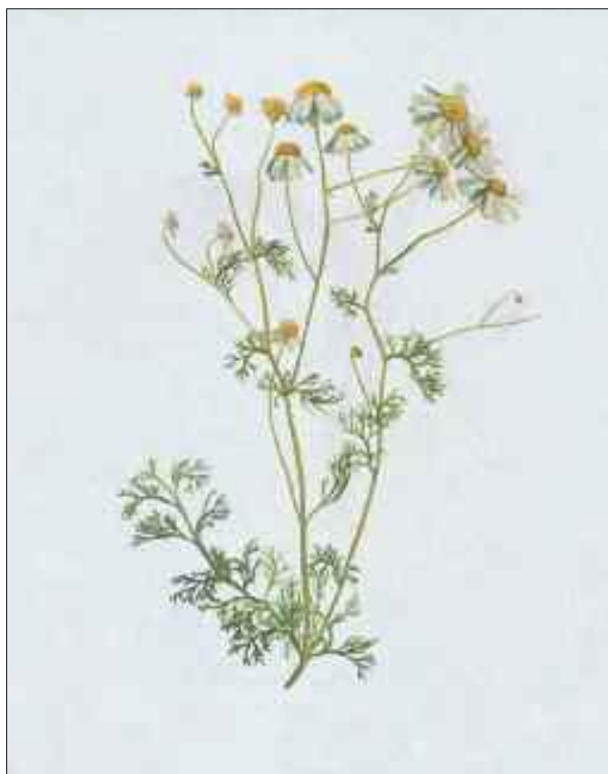
Camomilla ( Matricaria chamomilla )