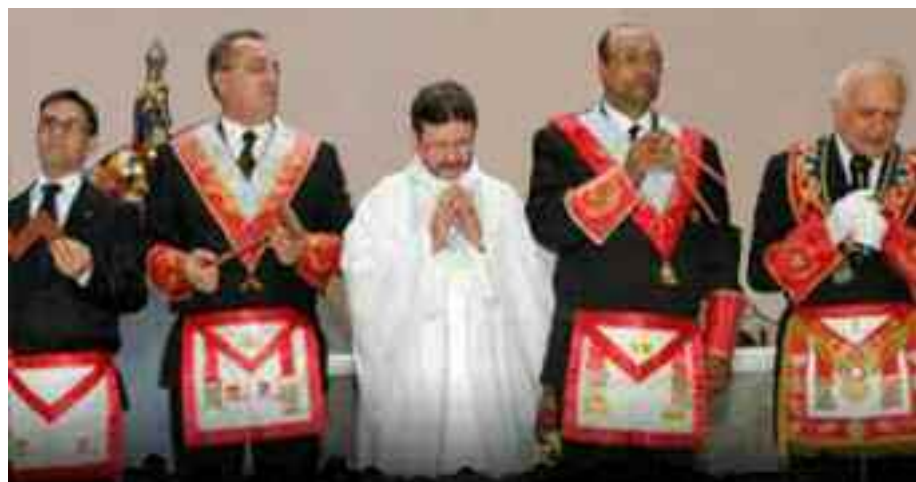
LA CHIESA CATTOLICA DOPO IL VATICANO II

IL DISACCORDO QUINDI NON È CON LA CHIESA E LA CATTEDRA DI PIETRO, MA CON COLORO CHE, IMBEVUTI DI PRINCIPI LIBERALI, STANNO OCCUPANDO LA CHIESA INSEGNANDO DOTTRINE GIÀ CONDANNATE DALLA TRADIZIONE.