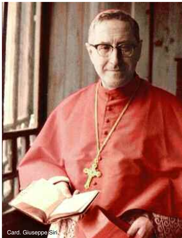
Card. Giuseppe Siri.

IL "PROGRESSO" È UN SEGNO DI VITA DEGLI SPIRITI MIGLIORI.