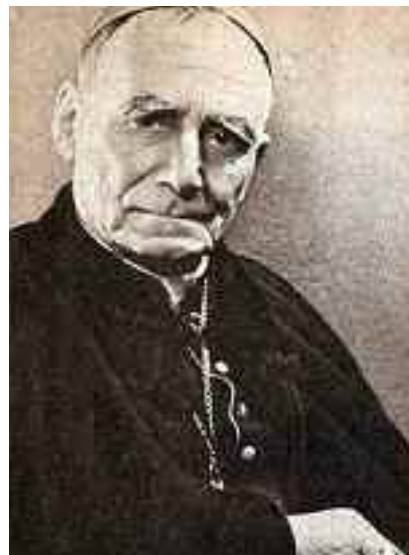
Card. José María Caro y Rodríguez, Primo Cardinale di Santiago, Cile (1939-1958).

La libertà massonica che conduce un uomo a pensare di essere lui stesso dio, naturalmente porta a tutte le rivoluzioni e alla più assoluta anarchia; e se quell’ideale non