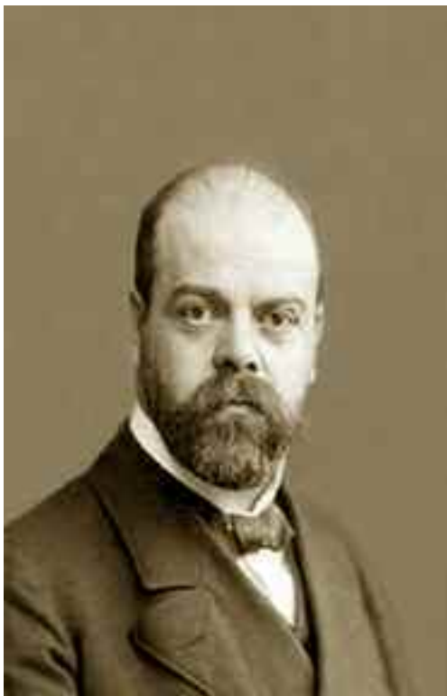
Izrail Lazarevic Gel'fand soprannominato Alexander Helphand Parvus.