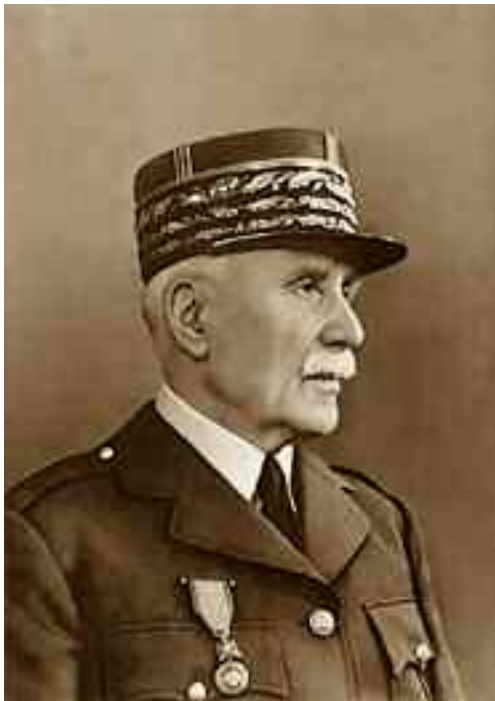
Il gen. francese Petain.