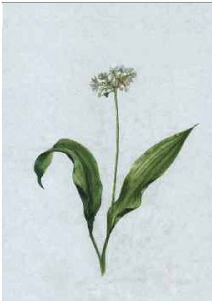
Aglio orsino ( Allium ursinum )

Con ogni primavera nasce l'attesa del sole e del caldo. Intimamente ci pervade un senso di serenità e di slancio, siamo lieti del primo verde e del giubilo del mondo degli uccelli e lo percepiamo con tutto il cuore, come un dono amorevole del nostro Creatore. In considerazione di tanta grazia sarebbe opportuno intraprendere una cura primaverile, una disintossicazione e purificazione che ci darà una salutare rinfrescata nient'affatto disprezzabile.