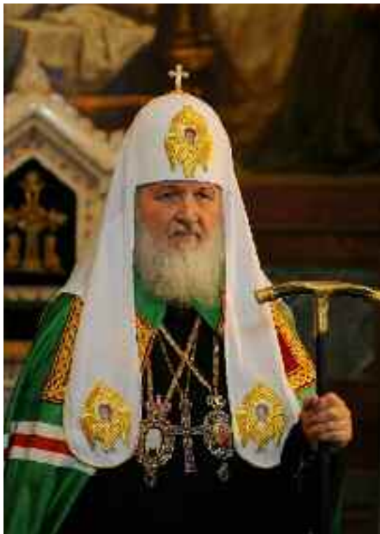
Il Patriarca di Mosca, Cirillo.