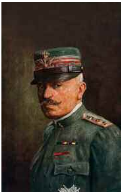
Il Generale Luigi Cadorna.

Non fu certo arrestata per la bravura del Generale Cadorna,