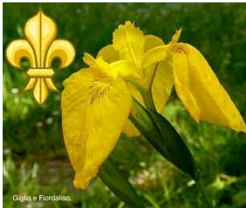
Giglio e Fiordaliso.

«La battaglia, che avverrà in seguito, per liberare il Papa a Roma non sarà così terribile come quella combattuta per il Re Enrico V» (1° ottobre 1875).