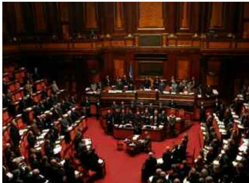
Il Parlamento italiano.

Gesù Cristo disse che avrebbe visitato la Francia tre volte col flagello della sua ira , poiché essa non riconosce più il suo Creatore. Con la prima visita , avrebbe distrutto il suo orgoglio, i suoi raccolti, il bestiame e gli uomini; con la seconda , Parigi, il bordello d'Europa, avrebbe perso i suoi Capi politici e sarebbe precipitata nel caos; con la terza visita , avrebbe fatto cadere la Francia sotto il giogo di stranieri che avrebbero visto palazzi in fiamme, case in ro-