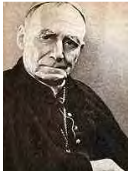
Card. José Maria Caro y Rodriguez, Primo Cardinale di Santiago, Cile (1939-1958).

Quelli che insegnavano la dottrina cristiana ricevevano la proibizione di continuare a farlo, mentre persino gli anarchici potevano predicare le loro dottrine antisociali senza alcuna