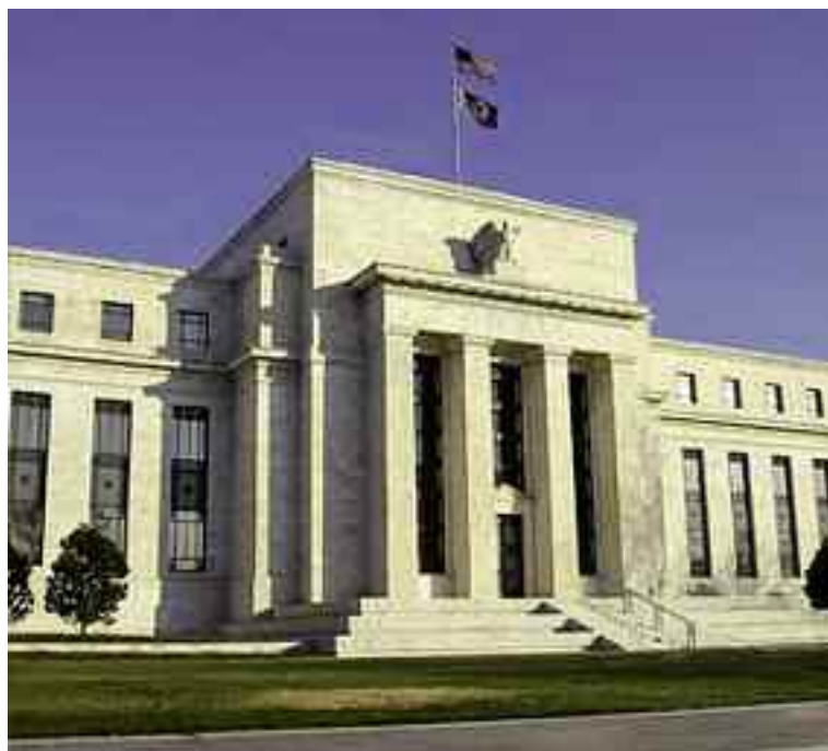
I principali artefici della Federal Reserve Bank , fondata nel 1913, furono: i banchieri di Wall Street J.P. Morgan, Jacob Schiff, Paul Warburg, Teddy Roosevelt e il Colonnello Mandel House , figlio di Jeroboam Rothschild il capo della Casa parigina dei Rothschild . Nel primo quarantennio di attività della Federal Reserve , ben 14.000 banche americane fallirono e milioni e milioni di risparmiatori videro svanire i loro sudati risparmi. Nel descrivere l’operato della Federal Reserve , il congressista Louis T. McFadden , il 10 giugno del 1932, davanti al Congresso disse: «Signor Presidente, noi abbiamo in questo Paese una delle più corrotte istituzioni che il mondo abbia mai conosciuto . Mi riferisco alla “ Federal Reserve Board ” e alla “ Federal Reserve Bank ” che hanno sottratto al Governo e alla popolazione degli Stati Uniti somme di denaro sufficienti a ripagare più volte il debito nazionale . Questa malvagia istituzione ha impoverito e mandato in rovina il popolo degli Stati Uniti; è andata lei stessa in bancarotta, trascinandovi insieme il Governo».