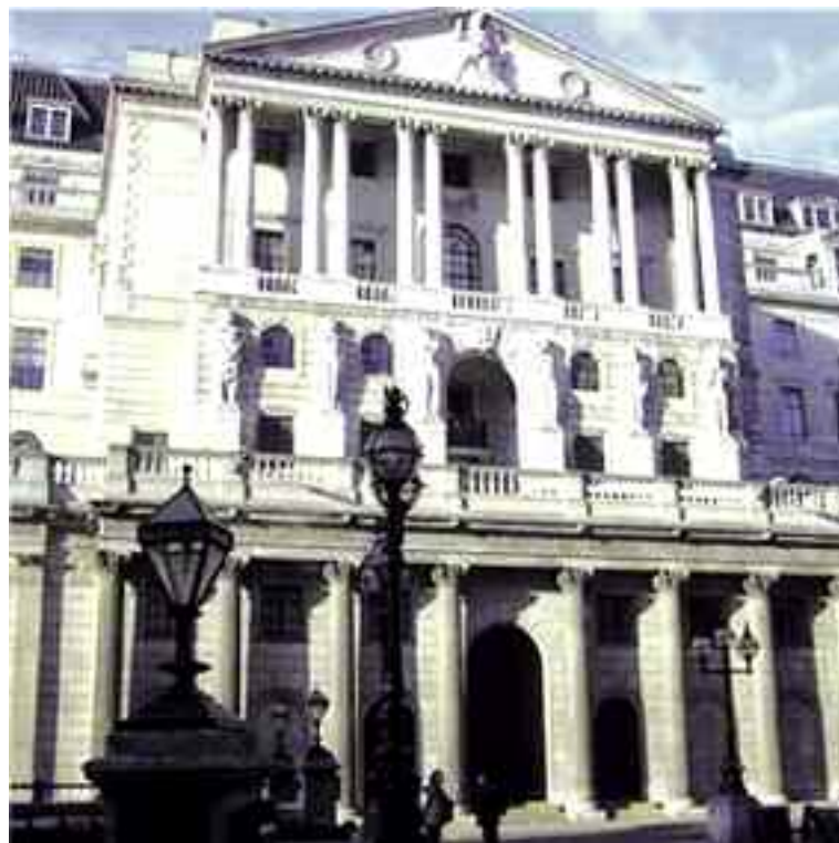
La Banca d’Inghilterra fu fondata nel 1694 con un accordo su tre punti: 1) che figurasse solo il nome del presidente e non i nomi degli altri presenti intorno al tavolo; 2) che la Banca potesse stampare banconote fino a 10 volte il valore della sua ricchezza; 3) che la Banca avesse il diritto di detenere il Debito pubblico dell’Inghilterra.

Così facendo, l’ELITE ha voluto testare il livello di sottomissione del Gregge Umano ai fini di procedere alla instaurazione di un loro antico ed anelato sogno: un NUOVO ORDINE MONDIALE .... con l’Imposizione