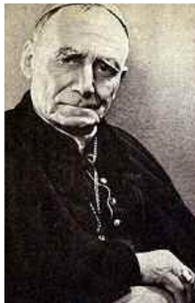
Card. José Maria Caro y Rodriguez, Primo Cardinale di Santiago, Cile (1939-1958).

La Fratellanza è un altro modo col quale la Massoneria diffonde intorno ad essa un'atmosfera di simpatia, specialmente tra quelli che hanno bisogno di essere incoraggiati nella vita.