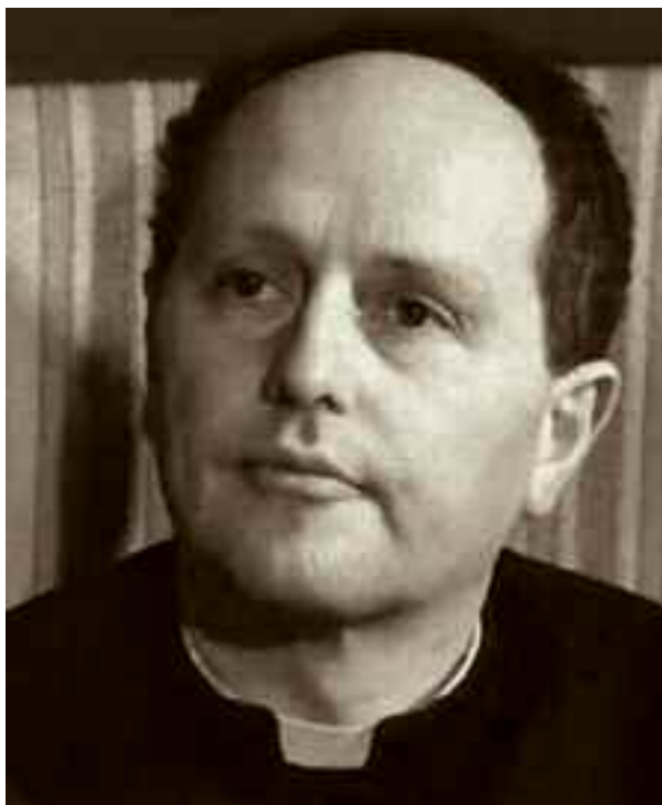
Don Lorenzo Milani.