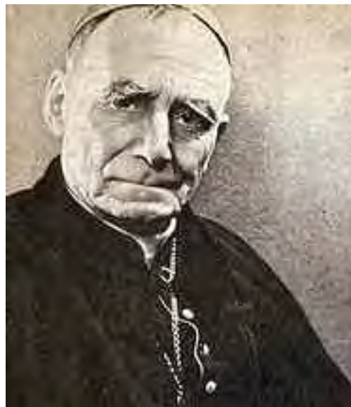
Card. José Maria Caro y Rodriguez, Primo Cardinale di Santiago, Cile (1939-1958).