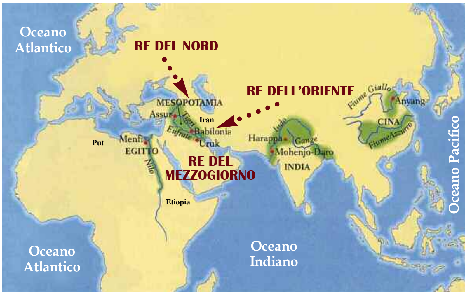
Carta geografica del continente Euro-Afro-Asiatico.

Che sia una restaurazione materiale, non sembrerebbe esservi dubbio (Ezech. 36; 8). Anche in Ezech. 37 si parla di restaurazione materiale, come Nazione, e che, poi, verrà la rinascita spirituale.