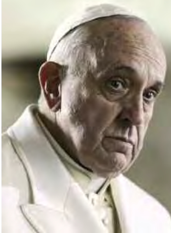
Francesco "vescovo di Roma".

Sua Santità, Papa Francesco Città del Vaticano Gennaio 2016