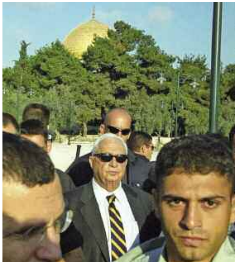
28 settembre, 2000. Sharon , scortato da centinaia di agenti e poliziotti, entra nella Spianata delle Moschee per visitare il Monte del Tempio , luogo sacro ai musulmani. Fu un drammatico gesto dimostrativo che, secondo molti, portò alla Seconda Intifada palestinese.

Con la seconda coppa della Sua ira, Dio presenta il conto alle nazioni e sconvolge gli equilibri politico-militari mondiali. La prima potenza militare mondiale, gli Stati Uniti, viene annientata e, questo, fa emergere la nuova potenza mondiale: la Russia.