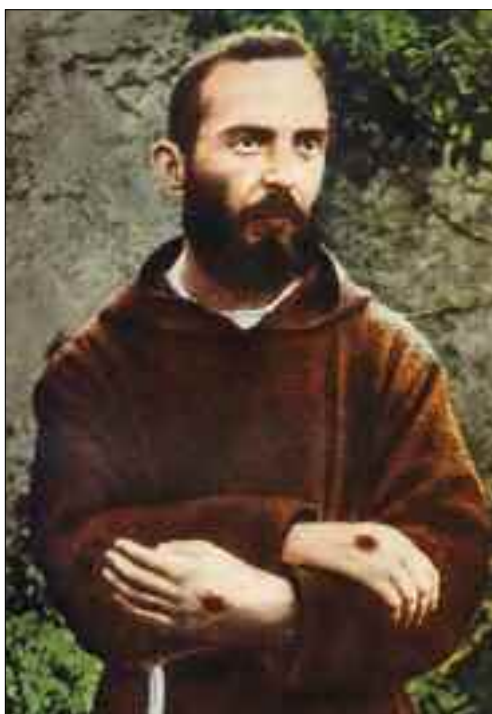
Padre Pio con le stigmate.