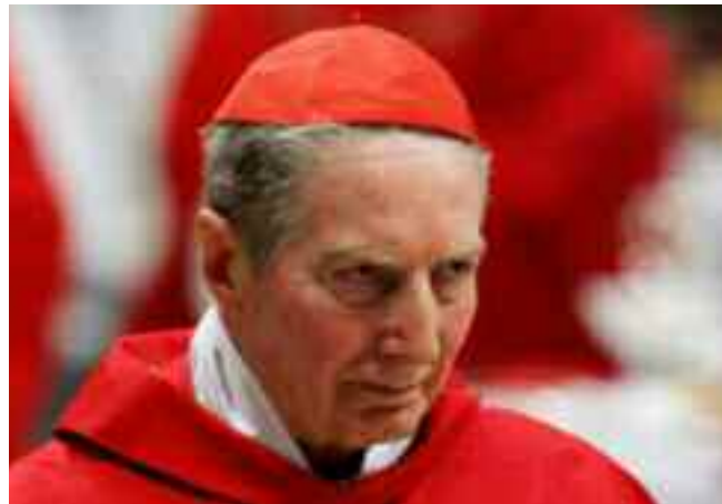
Il card. Carlo Maria Martini.

Ripresentiamo un articolo interessante, pubblicato diversi anni fa.