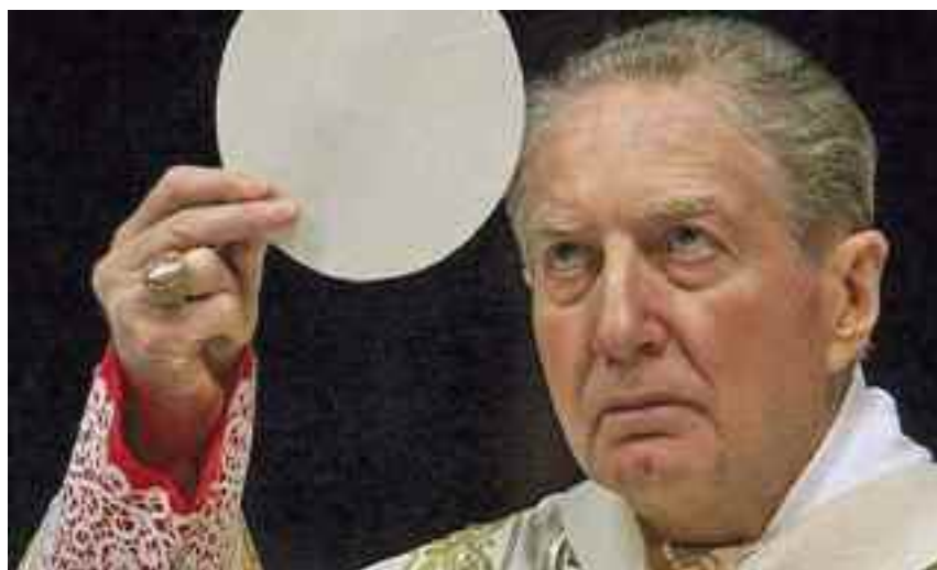
Il card. Carlo Maria Martini.

Non vi è alcun dubbio in proposito. Questa è la vera e autentica legge del progresso organico. Questo è l'ordine meraviglioso disposto dalla natura per ogni crescita. Nell'età matura si dispiega e si sviluppa in forme sempre