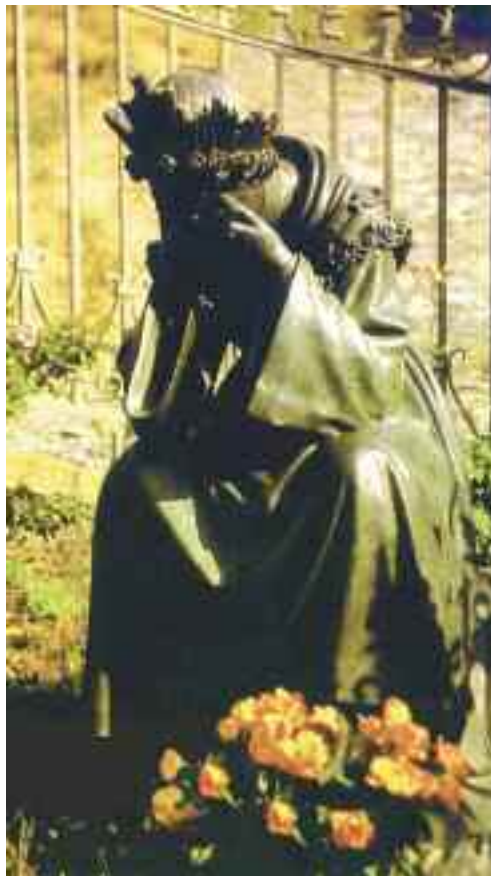
Madonna de La Salette.

I governanti civili avranno tutti lo stesso disegno, che sarà quello di abolire e di far sparire qualsiasi principio