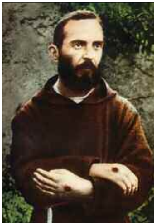
Padre Pio con le stigmate.

Ecco cosa scrive Franco Bellegrandi , nel suo libro: “ Nichitaroncalli - controvita di un Papa ”, a proposito di quel periodo di collaborazione di don Loris Capovilla