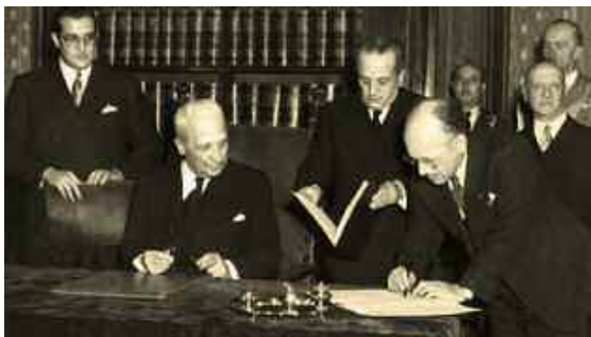
Roma 27 dicembre 1947. De Gasperi, De Nicola e Terracini alla firma della Costituzione italiana a Palazzo Giustiniani.

L'ultima fase di questo piano infernale era la grande catastrofe politica e sociale che fu così presentata al gruppo di banchieri ebrei: « non rimarranno che masse di proletariato nel mondo con pochi ricchi devoti alla nostra causa e forze di polizia e militari sufficienti a proteggere i nostri interessi ».