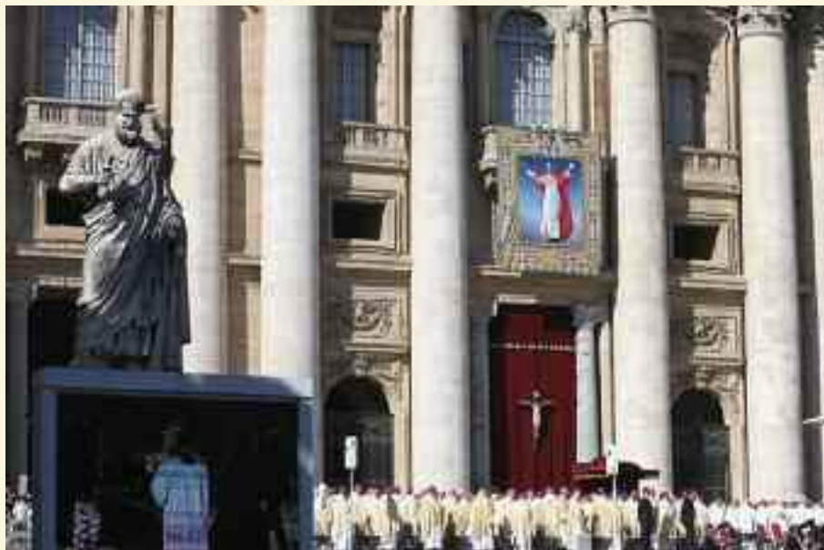
19 ottobre 2014. Beatificazione di Paolo VI.

Avete beatificato Paolo VI sapendo che Egli: