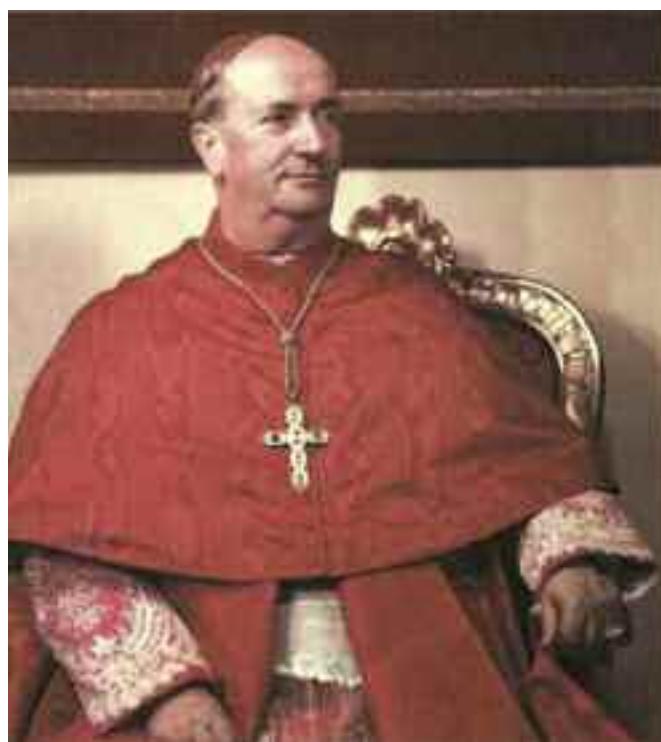
Il card. Alfredo Ottaviani.

Nel 1935, Pio XI chiama Ottaviani come assessore al S. Uffizio e se ne serve nel 1937, essendo quel Papa già ammalato di tumore, per la stesura dell’Enciclica sul comu-