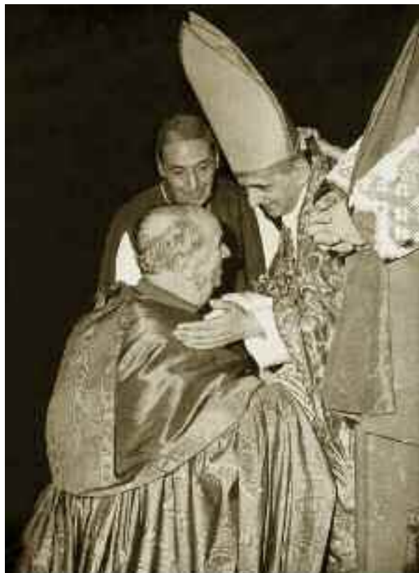
Il nuovo papa, Paolo VI, riceve l’ubbidienza da S. Em. il Card. Alfredo Ottaviani.

Il caso più eclatante, però, è quello del 30 ottobre del 1962 quando al card. Ottaviani , che parlava in aula sulla liturgia ed aveva superato i 10 minuti di tempo, venne spento il microfono dal card. Alfrink tra gli applausi dei neomodernisti 2 . Ogni commento è superfluo: il ‘maggio del