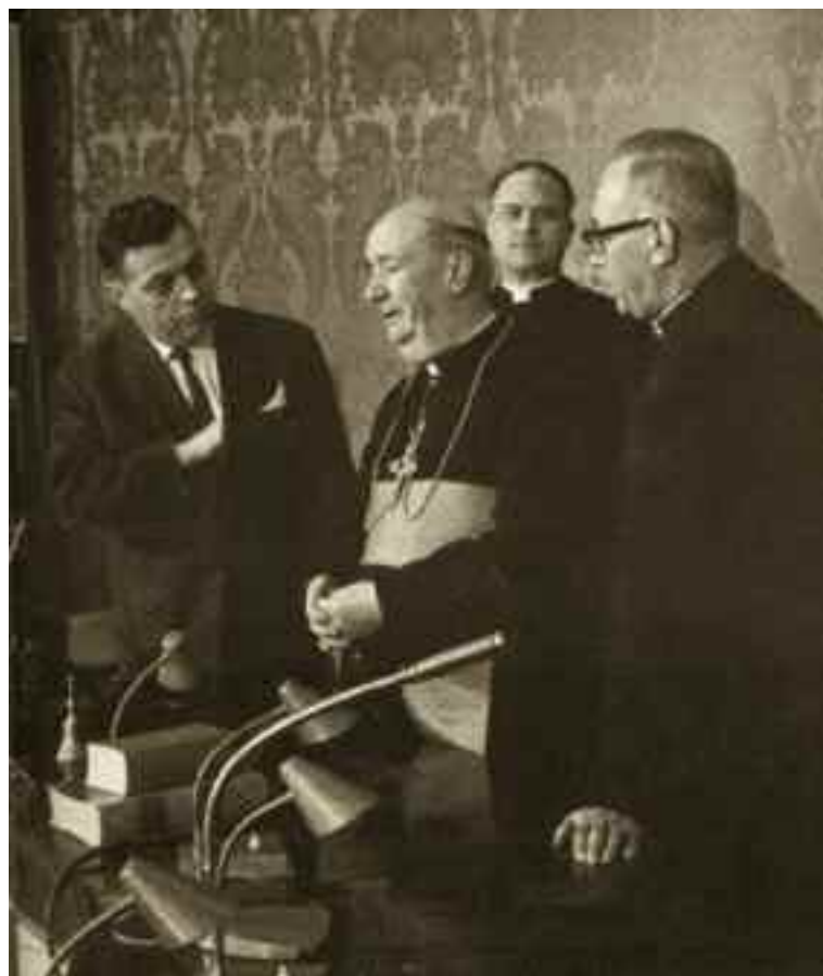
Dicembre 1967. Ultima intervista al card. Alfredo Ottaviani . Nel 1967, il card. Ottaviani rassegna le dimissioni per non contribuire allo smantellamento del Sant’Ufficio. Rimane “Prefetto emerito” fino al 1969, quando viene dimesso per limiti di età. Nel 1970, Paolo VI esclude gli ottantenni dal Conclave. Nel 1974, Ottaviani partecipa alla “crociata del referendum abrogativo” della legge sul divorzio (passata in Italia nel 1969), perso per l’“indecisione” di Paolo VI .

Che Egli ci aiuti a restare fedeli alla immutabilità sostanziale del dogma, della morale naturale e della Liturgia di Tradizione apostolica per sentirci dire il giorno del Giudizio: «Euge, serve bone et fidelis, quia in pauca fuisti fidelis intra in Gaudium Domini tui» (Orsù, servo buono e fedele, poiché sei stato fedele nel poco entra nella Gioia del tuo Signore).