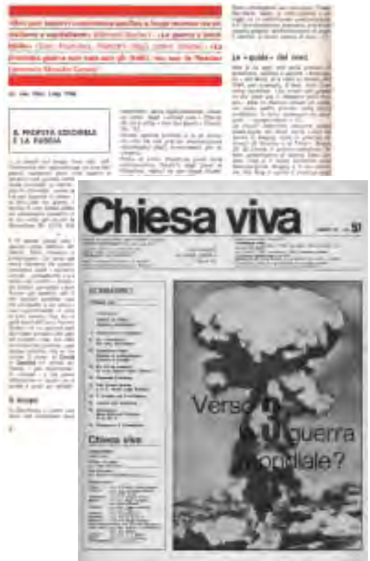
Chiesa viva n. 57, octubre 1976, en la cual aparece el artículo: “ El profeta Ezequiel y Rusia ”, que trata de la Tercera Guerra mundial.

En Ezequiel hay indicaciones similares que precisan este tiempo. Ante todo, se habla explícitamente, varias veces, de los “ últimos años ” (Ez. 38; 8) y del “ fin de los días ” (Ez. 38; 16). Además, esta profecía está en un contexto de precisas enumeraciones cronológicas de los sucesos que se producirán. Ante todo: Ezequiel habla de la restauración de los Hebreos en Palestina , exiliados por una amplia dispersión de dimensiones mundiales. Que se trate de una restauración material, no parecería haber dudas (Ez. 36; 8). Incluso en Ez. 37 se habla de restauración material, como Nación, y que, luego, será el renacer espiritual .