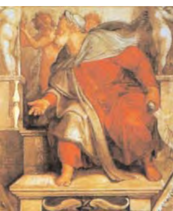
El profeta Ezequiel.

«... y el rey del septentrión le caerá encima (al jefe de Israel) como una turbina, con carros y caballos y con muchas naves; entrará en su territorio invadiéndolo». (Dan 11, 40).