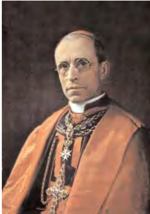
Papa Pío XII.

Y en el campo civil y político, ¿cómo no reconocer en el caos del orden y de la justicia y también en el furor de la supresión de todo principio religioso y en la difusión del materialismo, ate-