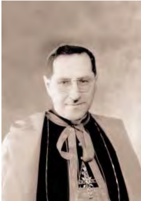
El card. Giuseppe Siri en el 1955.

El “nuevo camino” fue encontrado en 1958: el card. Siri fue electo papa con el nombre de Gregorio XVII , pero, con tremendas amenazas, fue obligado a dimitir dejando el puesto al masón Juan XXIII , al que todos los Cardenales conocían como el paso indispensable para la elevación al papado de Mons. G.B. Montini, el predilecto de la Masonería mundial .