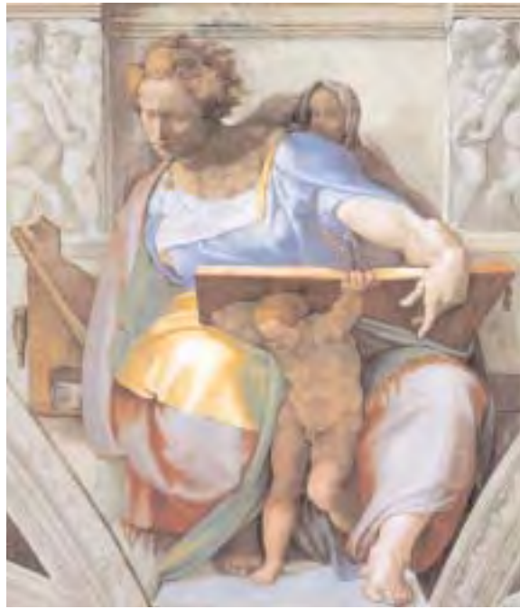
El profeta Daniel.

«Antes, en efecto, deberá llegar la apostasía y deberá ser revelado el hombre inicuo , el hijo de la perdi-