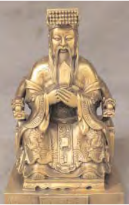
Estatuilla de Confucio. Voltaire exaltó la figura de Confucio venerado por los chinos como el Sabio fundador de su cultura.

“modelo chino” el modo más seguro de alcanzar el “objetivo final” de los Illuminati.