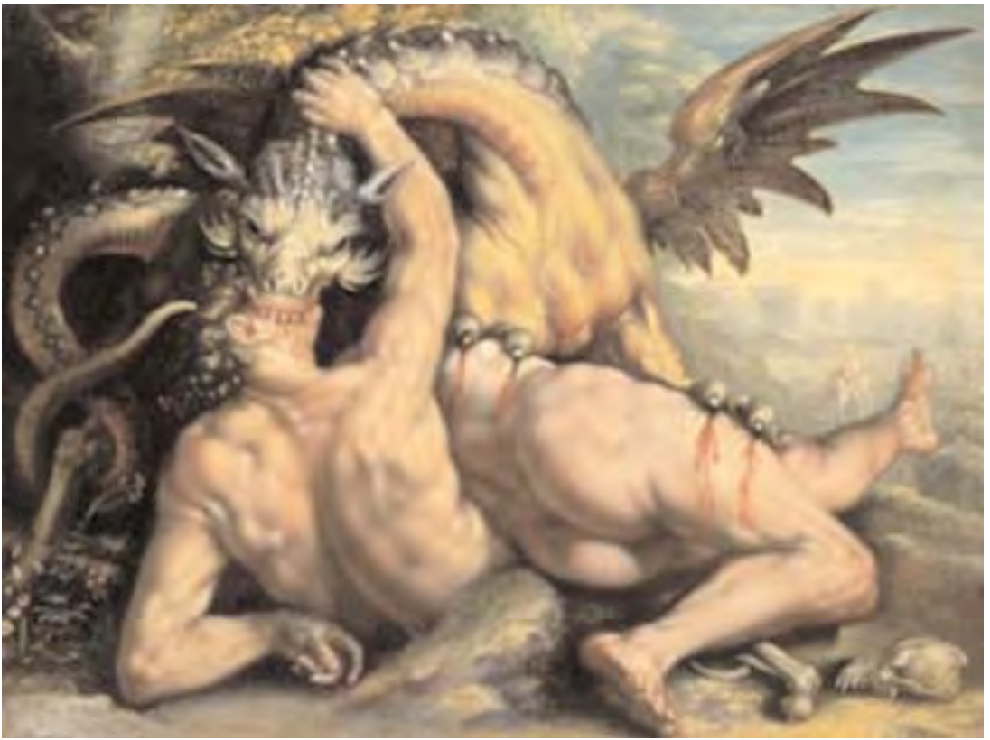
El dragón del Apocalipsis.