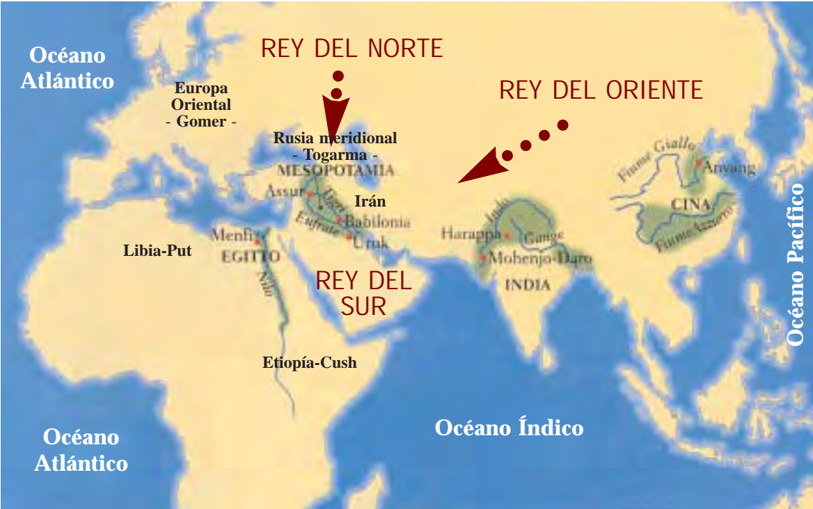
Carta geográfica del continente Euro-Afro-Asiático.

Un mapa del antiguo imperio romano los coloca en la actual área de Polonia, Checoslovaquia y Alemania Oriental hasta el Danubio. El mismo cuadro geográfico se encuentra confirmado también en el moderno Talmud.