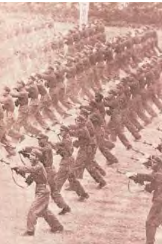
Un ejercicio del ejército chino como preparación a la guerrilla.

El número de estos soldados, que avanzarán por tierra, será inmenso: millones y millones de soldados que la China ha preparado y planificado, desde hace largo tiempo, para esta guerra de conquista.