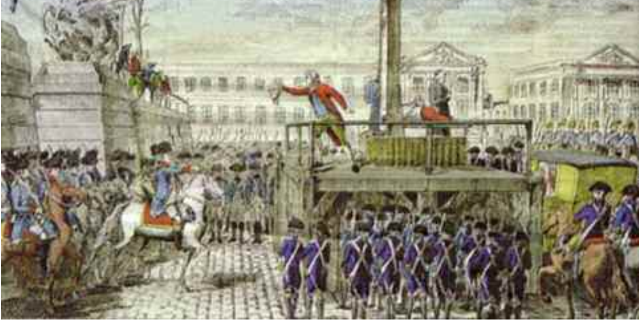
Il Re di Francia, Luigi XVI, ghigliottinato.