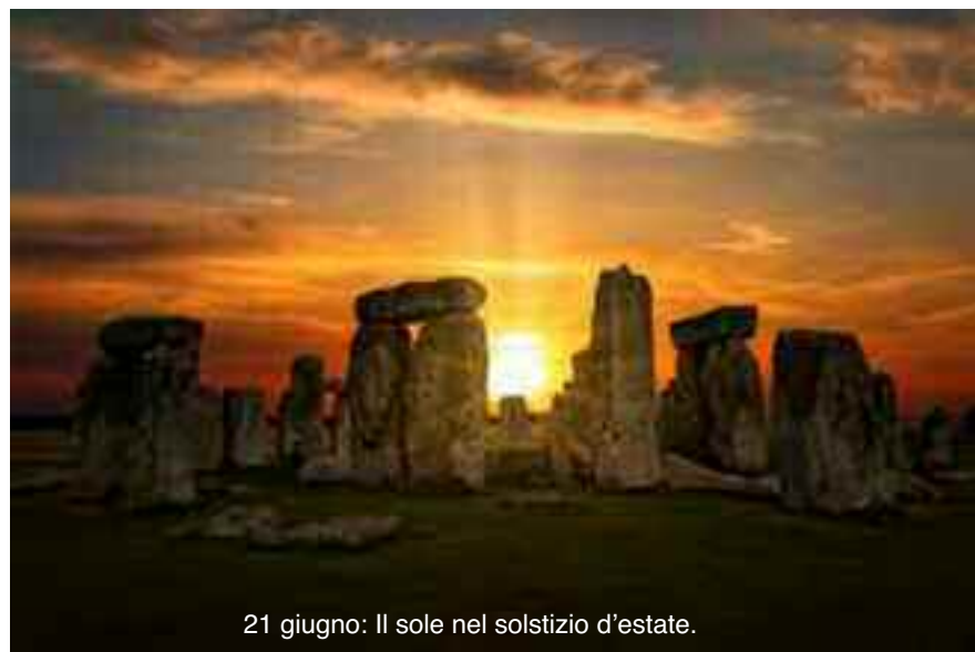
21 giugno: Il sole nel solstizio d'estate.

È interessante notare che, mentre il significato simbolico dei numeri nella Bibbia è usato da Dio stesso, la numerologia, condannata da Dio come forma di divinazione, è usata dai suoi nemici per trasmettere messaggi occulti diretti solamente a cabalisti, esperti, alti iniziati della Massoneria e che non sono certo ignoti a Dio.