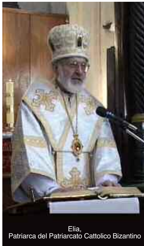
Elia, Patriarca del Patriarcato Cattolico Bizantino

Sono i suoi demonologi piuttosto che teologi. Theos = Dio, logos = dottrina. L’opposto della teologia è la demonologia corrente, accettabile per tutti gli apostati.