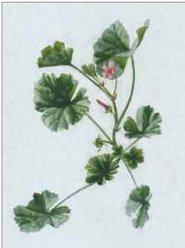
Ramo di "Malva" (Malva vulgaris)

1. La Malva si dimostra efficace soprattutto sotto forma di tisana nelle infiammazioni delle mucose interne e cioè nelle gastriti e nelle infiammazioni della vescica , nelle gastroduodeniti e nelle stomatiti , così come nelle ulcere gastriche e duodenali . In questi casi, si prepara una minestra di foglie di Malva e orzo. Prima, si cuoce l'orzo, al quale, una volta raffreddato, si aggiungono le foglie di Malva.