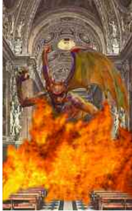
Eletto sotto la minaccia di sterminio del conclave, Paolo VI, il 29 giugno 1963, fece celebrare una doppia messa nera, a Roma e a Charleston, per intronizzare Satana nella Cappella Paolina.