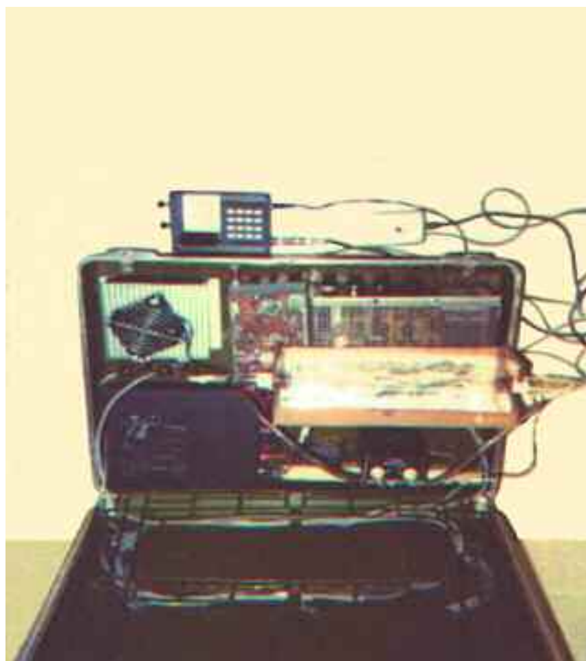
Uno strumento di generazione di frequenze per la terapia di frequenze di Royal Raymond Rife.

Mentre questa tecnologia è perfettamente legale per i veterinari usarla per salvare la vita degli animali, la brillante terapia di frequenza di Rife rimane un tabù per la medicina ortodossa tradizionale , e questo a causa della continua minaccia che essa pone al monopolio farmaceutico internazionale che controlla le vite – e la morte – della stragrande maggioranza delle persone su questo pianeta.