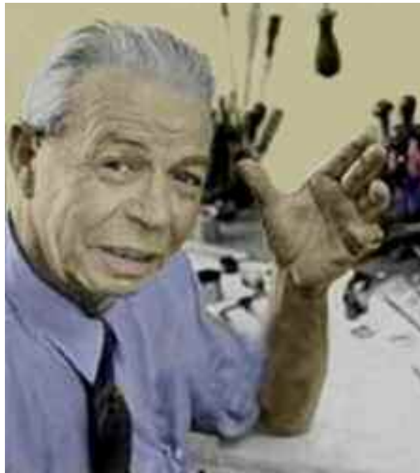
Royal Raymond Rife.

A umentando l'intensità di una frequenza, che risuonava naturalmente con questi microbi, Rife aumentava le loro oscillazioni naturali fino a quando essi non si distorcevano e si disintegravano per gli stress strutturali. Rife chiamava questa frequenza the “ Mortal Oscillatory Rate ” (MOR) “(tasso oscillatorio mortale) e questo processo non recava alcun danno ai tessuti circostanti.