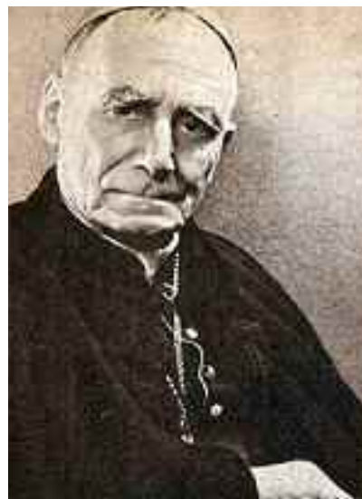
Card. José Maria Caro y Rodriguez, Primo Cardinale di Santiago, Cile (1939-1958).

Abbiamo già visto che la Massoneria era padrona in Francia, durante la Rivoluzione Francese, come lo era stata anche prima della Guerra, secondo la confessione degli stessi massoni.