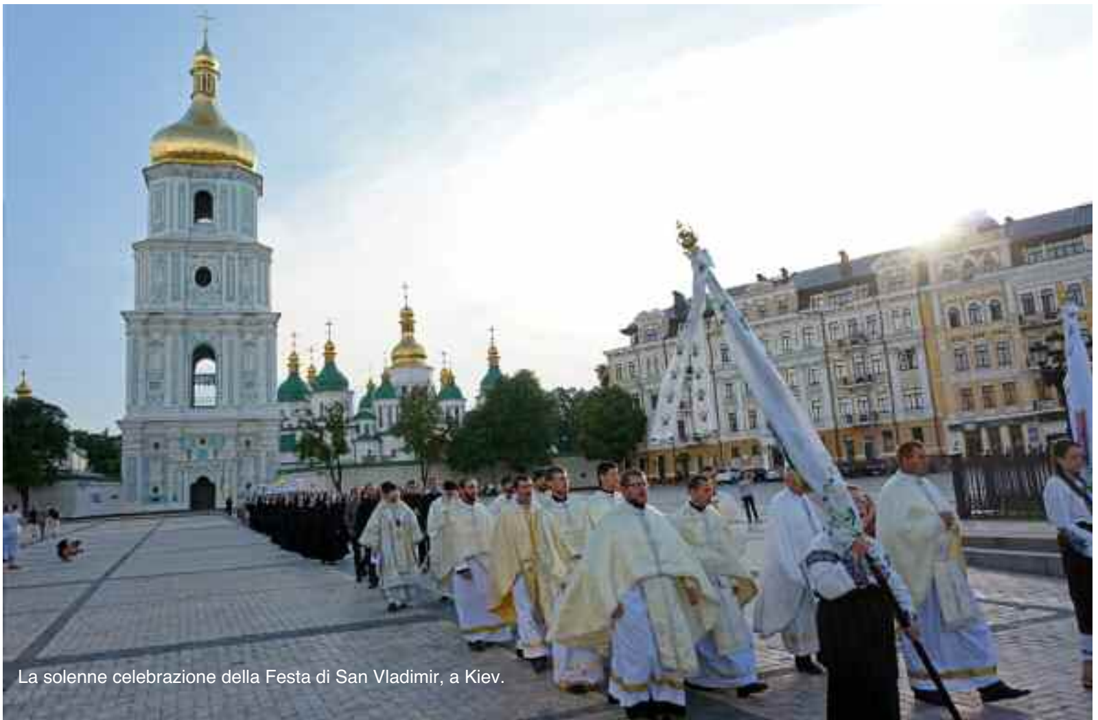
La solenne celebrazione della Festa di San Vladimir, a Kiev.