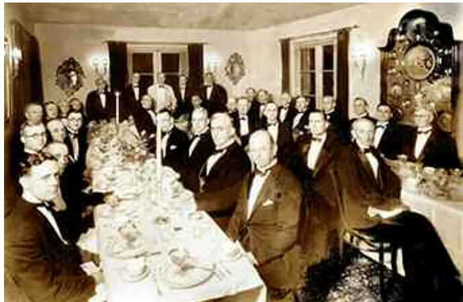
20 novembre 1931. Cena party offerta in onore dei risultati ottenuti da Royal Raymond Rife, alla quale hanno partecipato oltre 30 dei più illustri medici degli Stati Uniti.

Nessun prezzo era troppo alto per sopprimere Rife. Ci si deve ricordare che, oggi, il trattamento di un singolo mala-