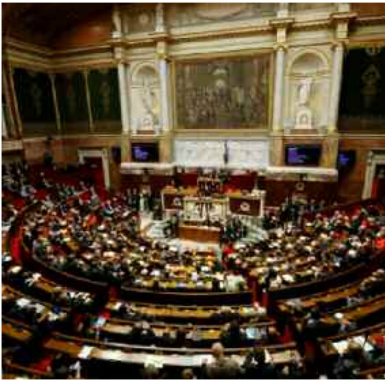
La Camera dei Deputati dell'Assemblea Nazionale, a Parigi.

«Dopo la prima crisi rivoluzionaria a Parigi, vi sarà un “breve respiro”. Allora quelli che si sono dichiarati “vincitori”, con (l’aiuto di) “uomini di scienza” provocheranno un “bagliore” che scuoterà la “Grande Città” (Parigi) (si tratterà forse di una bomba per guerra biologica?)» (28 settembre 1882).