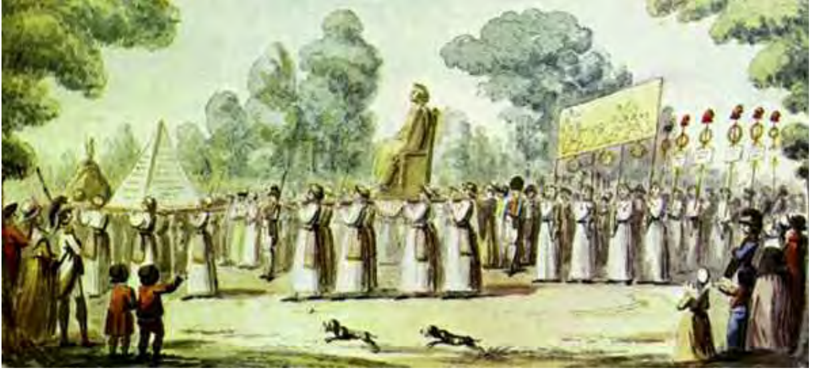
Processione in onore della “Dea Ragione”.

albero”! Chi era questo “ Essere supremo ” che si presentava sotto la forma di un “ grande albero ”, che simboleggiava la Natura e che riceveva gli omaggi dei capi della Rivoluzione?