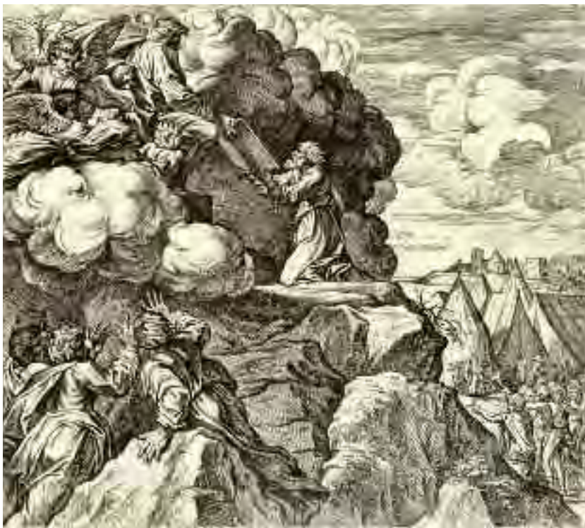
Mosè che riceve le tavole dei “Diritti di Dio” sul Monte Sinai. I “Diritti dell’uomo”, quindi, hanno la loro radice nell’adempienza dei suoi “doveri” verso i “Diritti di Dio”!

avremo una società di povere creature ingannate, che tutto sacrificano per ottenere la felicità in una esistenza futura» 23 .