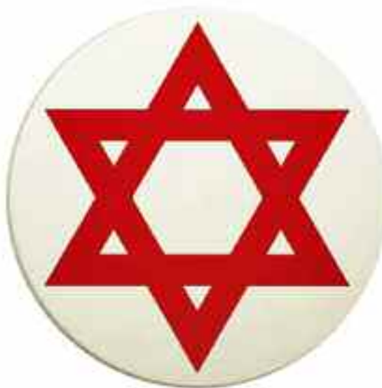
La Stella a 6 punte, simbolo della famiglia Rothschild, anticamente presso i sacerdoti Druidi simboleggiava i sacrifici umani. Salomone, quando si convertì al satanismo e all'idolatria, diede al suo popolo questo simbolo.

Amschel Mayer Bauer visse fino al 1812 ed ebbe cinque figli, tutti educati e addestrati per divenire dei Capitani