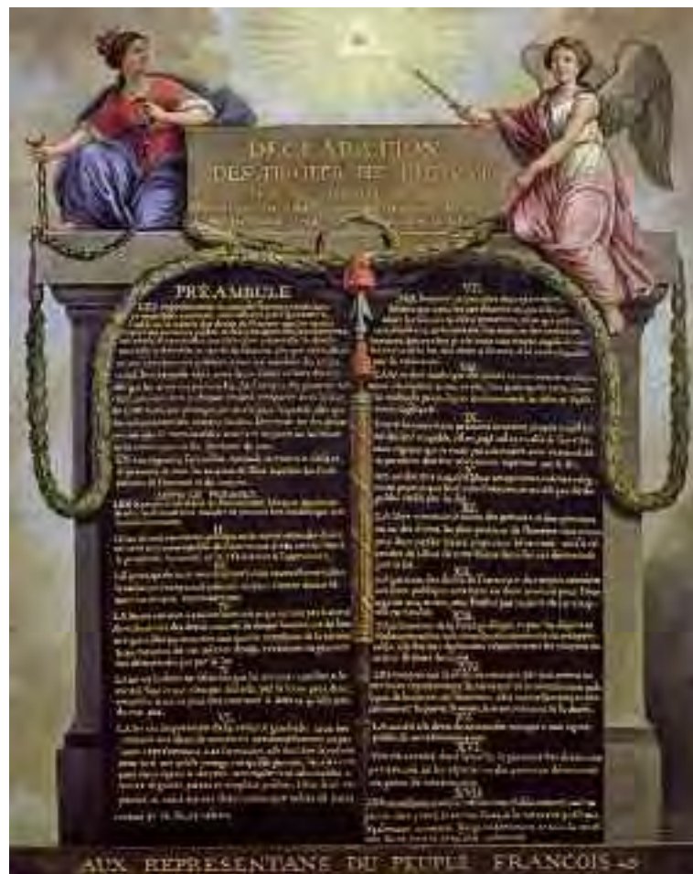
Il testo della Dichiarazione dei “Diritti dell’uomo e del cittadino”, in una stampa apologetica.