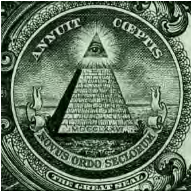
La piramide degli Illuminati che compare sul dollaro.

portare alla rovina economica i Goyim nei loro interessi finanziari nazionali e nei loro investimenti. In campo internazionale, egli disse che potevano essere spinti fuori mercato. Questo si poteva ottenere con un accurato controllo delle materie prime, con agitazioni organizzate dei lavoratori per avere una riduzione dell'orario di lavoro, ma con aumenti salariali, e con la sovvenzione dei loro concorrenti. Rothschild ammonì i suoi cospiratori che essi dovevano fare in modo che “gli aumenti salariali ottenuti dai lavoratori non dovevano beneficiarli in alcun modo” .