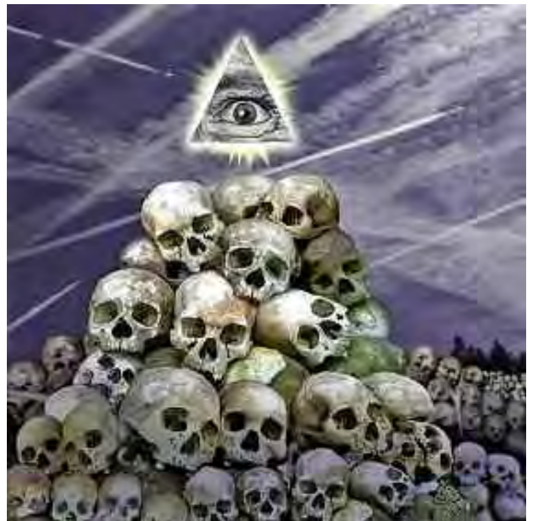
La piramide-simbolo dello scopo ultimo degli Illuminati di Baviera.

Questo chiarisce che Rothschild stava rivolgendosi a uomini che avevano aderito al “Movimento Rivoluzionario Mondiale” che ebbe inizio con il “Pale of Settlement” 2 (= Confine di insediamento) situato nella parte occidentale della Russia. A questo proposito, si deve ricordare che prima che Amschel Moses Bauer si stabilisse a Francoforte sul Meno (Germania), egli aveva esercitato il suo mestiere di orefice e argentiere, viaggiando estensivamente nell'Est europeo dove egli, indubbiamente, aveva incontrato gli uomini ai quali suo figlio, Amschel Mayer, si era rivolto, dopo esser cresciuto da presta-denaro a banchiere, e dopo aver stabilito “la Casa dei Rothschild” nella Judenstrasse di Francoforte, proprio il luogo in cui fu tenuto questo incontro, nell'anno 1773.