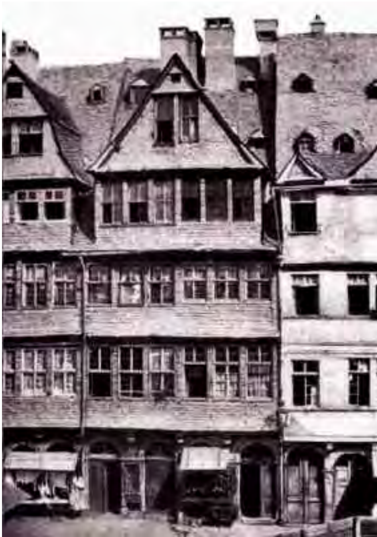
La casa della "Targa Rossa" ("Rothen Schild"), in Judenstrasse a Francoforte, nella quale nacque Amschel Mayer Rothschild, nel 1743, e dove egli tenne, nel 1773, una riunione con dodici persone ricche e influenti alle quali espose il suo "piano" per un Governo Mondiale.

Rothschild rivelò come la Rivoluzione Inglese fosse stata organizzata e mise in risalto gli errori che erano stati commessi. Il periodo rivoluzionario era stato troppo lungo; l'eliminazione dei reazionari non era stata eseguita con sufficiente rapidità e spietatezza; il programmato "regno del terrore", col quale si doveva ottenere la rapida sottomissione delle masse, non era stato messo in pratica in modo efficace. Malgrado fossero stati commessi tutti questi errori, lo scopo della Rivoluzione era stato raggiunto. I banchieri, che avevano istigato la rivoluzione, avevano stabilito il loro controllo sull'economia nazionale inglese e avevano consolidato il debito nazionale. Con l'intrigo, attuato su scala internazionale, essi avevano, poi, gradualmente aumentato il debito nazionale, prestando soldi per combattere le guerre e le rivoluzioni che essi avevano fomentato sin dal 1694.