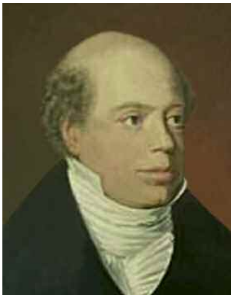
Amschel Mayer Rothschild, il capostipite della famiglia dei banchieri Rothschild, che nel 1773, lanciò il suo "piano" per un Governo Mondiale.

Rothschild, poi, sostenne che l'uso di alcool, droghe, corruzione morale ed ogni altra forma di vizi, fosse utilizzato, in modo sistematico, dai loro «Agentur» 1 , per