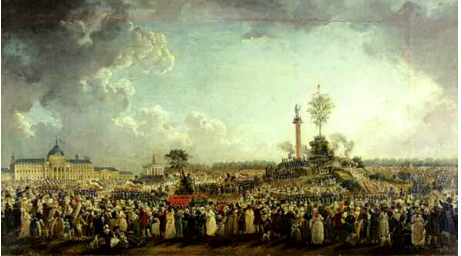
Festa dell'Essere supremo - 8 giugno 1794. (Musée Carnavalet, Paris. Si noti il "grande albero", che si staglia nel cielo, simbolo dell'Essere supremo!

Il Culto della Natura è l'attacco finale della Massoneria alla civiltà cristiana: l'effetto immediato è quello della scomparsa di ogni freno morale, della degenerazione dei costumi e dell'abbandono del rispetto per la vita umana. La ragione è chiara: «Il deismo professato da filosofi e Massoni non è altro che una divinizzazione della natura