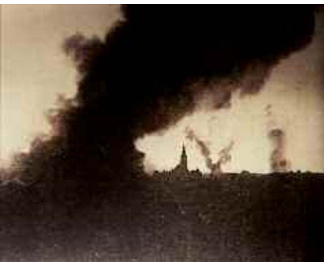
Maggio 1916. Asiago in fiamme.