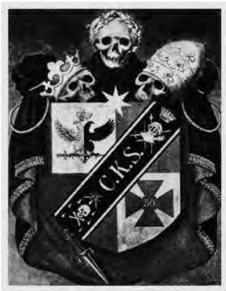
Stemma del 30° grado del Rito Scozzese che svela il programma politico massonico: distruggere la Chiesa, le Monarchie cattoliche e la civiltà cristiana.