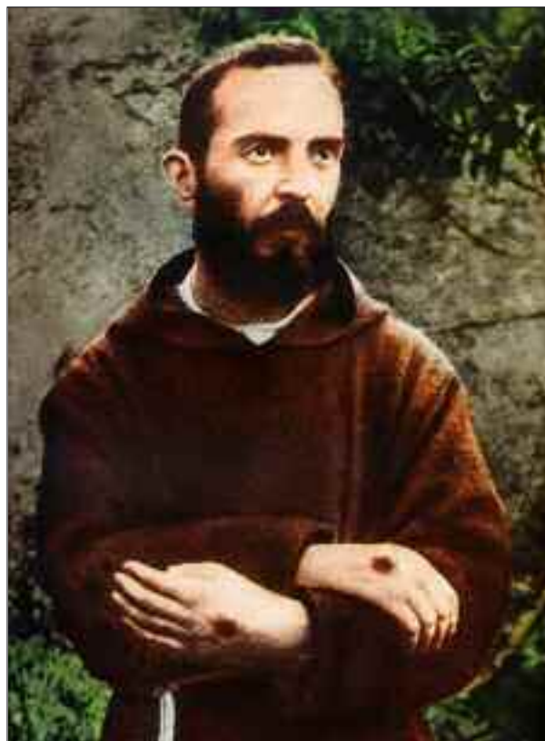
Padre Pio con le stigmate.