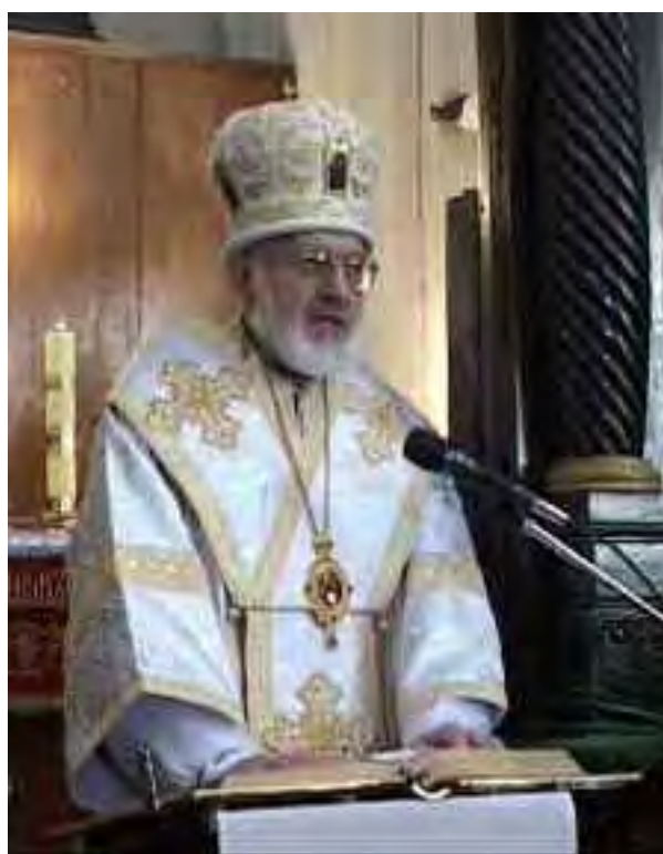
Elia, Patriarca del Patriarcato Cattolico Bizantino.

La Sacra Scrittura offre l'apostolo Paolo come esempio per un sacerdote celibe. Egli era non solo molto attivo ma anche profondamente spirituale. Dice: « Sono stato crocifisso con Cristo; non sono più io che vivo, ma Cristo vive in me » (Gal. 2, 20). Voi, vescovi e sacerdoti, egli invoca: « Diventate come me ». Egli era consapevole della dura realtà del peccato. In Romani 7, l'apostolo Paolo va alla radice e dice: « Mi diletto nella legge di Dio secondo l'uomo interiore. Ma vedo un'altra legge nei miei membri, che combatte contro la legge della mia mente e mi porta in cattività alla legge del peccato che è nei miei membri ». La sua più profonda esclamazione spirituale è: