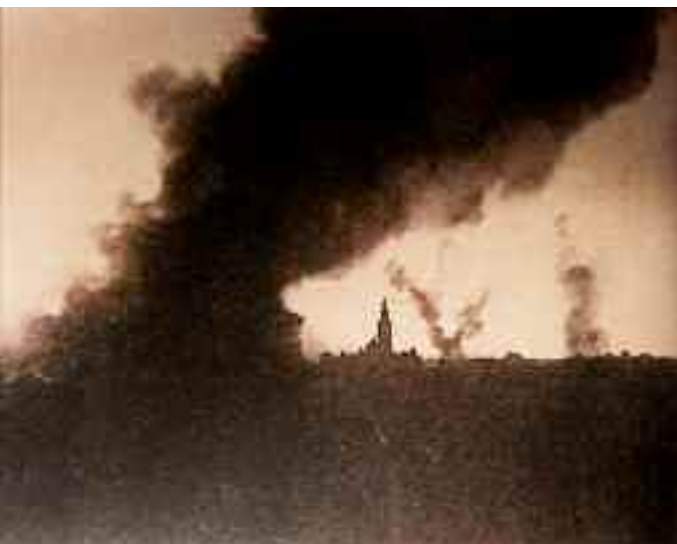
Maggio 1916. Asiago in fiamme.