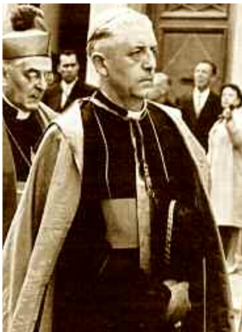
Il card. Joseph Suenens.

Così, il cardinale Suenens ha colpito il “ Primato del Pontefice ”, pretendendo la soluzione dei problemi ( celibato, controllo delle nascite, ecc. ) a base di dibattiti all’interno della Chiesa. È un