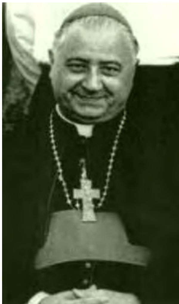
Mons. Annibale Bugnini, autore della Riforma Liturgica.

Il problema di presentare la dottrina, in modo che risponda alle esigenze di un certo tempo, di un certo periodo storico, di un certo grado e qualità di cultura, non esiste e non può esistere per la Chiesa Cattolica. Lo stesso Paolo VI, nella sua Enciclica “Mysterium fidei” del 3 settembre 1965, condannò l'espressione che le formule dogmatiche dei Concilli Ecumenici ecc.. “non sono più adatte agli uomini del nostro tempo...” , ma nel suo discorso di riapertura del Concilio, in data 29 settembre 1963, Paolo VI , non solo elogiò incondizionatamente tutto il tenore e gli scopi che Giovanni XXIII indicava in quel discorso, ma fece proprie tutte quelle istanze direttive che Giovanni XXIII impresse al Vaticano II, orientandolo verso la catastrofe che oggi abbiamo sotto i nostri occhi ancora increduli.