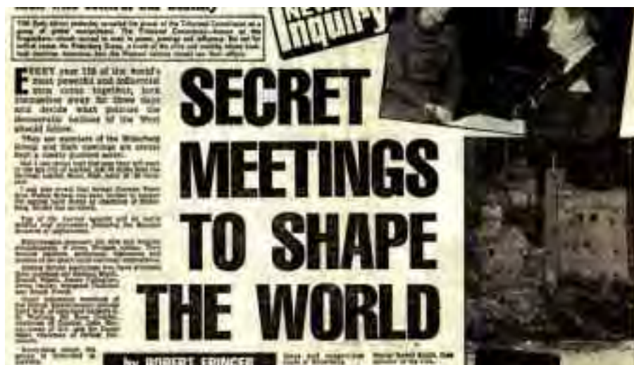
"Incontri segreti per plasmare il mondo".

Questa intervista ha avuto luogo il 30 maggio, tramite il settimanale russo "NoviDen". Un informatore che lavorava nel top management di una grande banca svizzera vuota il sacco riguardo a ciò che ha visto o sentito durante lo svolgersi della sua attività. Il panorama che viene tracciato rispecchia il peggio che la letteratura cospirazionistica ha attribuito alla corrotta gestione del potere mondiale. Ma qui viene detto da un insider che, ovviamente, non fornisce abbastanza dati per essere individuato, pena la sua morte.