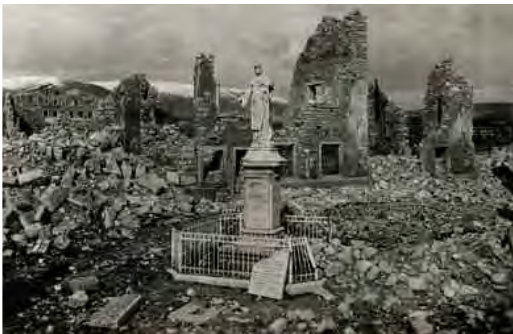
28 maggio 1916. Asiago “rasa a suolo” dalle artiglierie austriache.