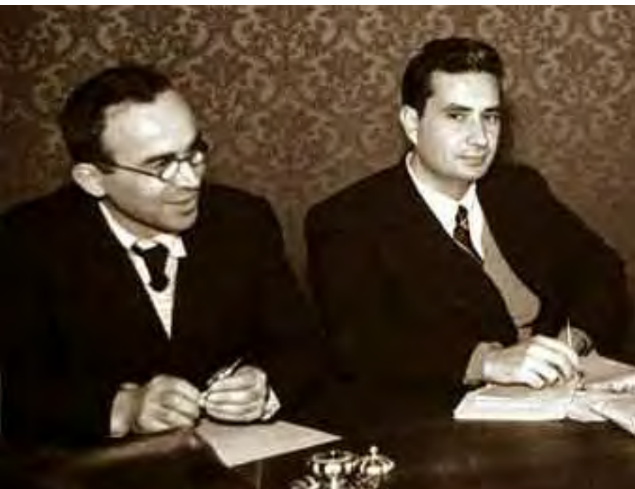
Giorgio La Pira e Aldo Moro.

Concludendo: è chiaro che la principale cura di La Pira fu che «non si facesse una specifica affermazione di fede... nella Santissima Trinità»!