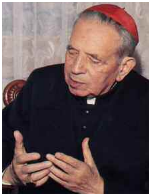
Il cardinale Giacomo Lercaro.

«Separare il tabernacolo dall'altare, equivale a separare due cose che, in forza della loro origine e natura, devono stare unite...».