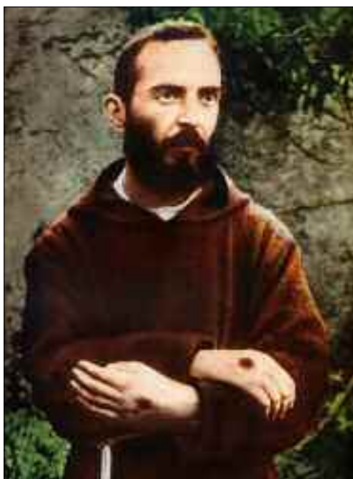
Padre Pio con le stigmate.