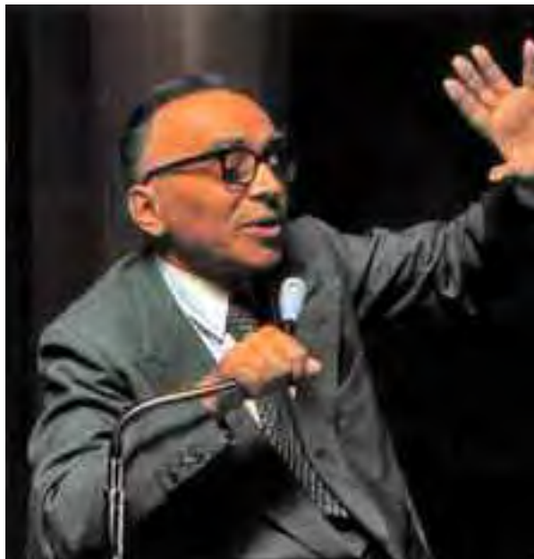
Giorgio La Pira

Sarà bene, perciò, che vediamo, passo passo, anche questo risvolto storico del “sindaco di Firenze” che la Curia fiorentina vorrebbe proporre per la “beatificazione”, ma sul quale Noi manteniamo le nostre gravi riserve per molte sue “tesi” e per molte scelte della sua vita. La “libertà di pensiero” non ci può proibire di pensare e di giudicare anche i “morti”, sia pure “nel Signore”, perché anche la morte non può cancellare i loro “errori”, fatti in vita! È da superficiali, perciò, dire che davanti alle tombe non