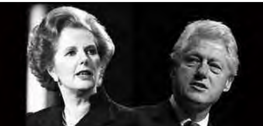
Margaret Thatcher e Bill Clinton due “favoriti” del Gruppo Bilderberg.

sere un “governo mondiale” ha aggiunto: «Dire che ci stiamo sforzando per un governo mondiale è esagerato, ma non del tutto ingiusto. Quelli del Bilderberg pensavano che non potessimo continuare a combattere l'un l'altro per niente e uccidere persone e rendere milioni di senzate. Quindi sentivamo che una singola comunità in tutto il mondo sarebbe stata una buona cosa».