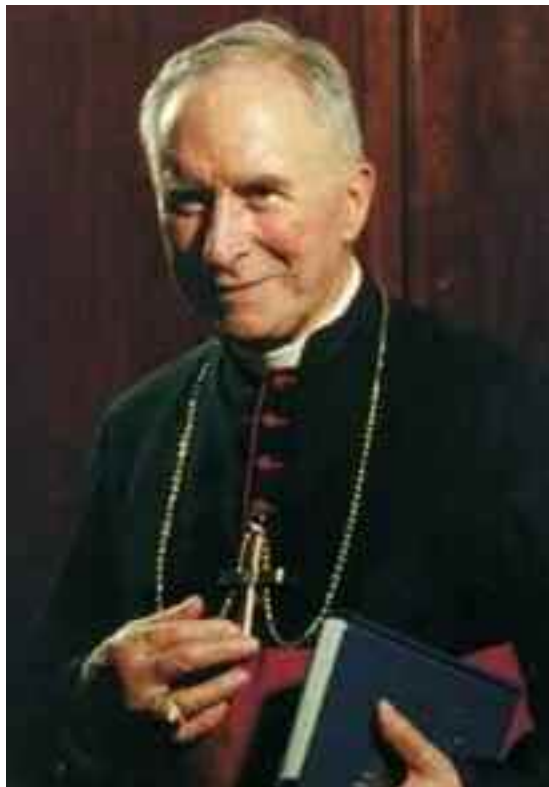
Mons. Marcel Lefebvre.

Proprio ciò che il Concilio di Trento ha condannato e il nuovo Messale ha nuovamente adottato.