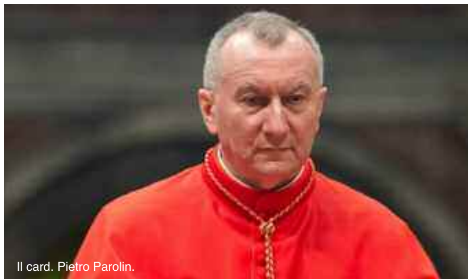
Il card. Pietro Parolin.

Con riferimento alla dichiarazione di Etienne Davignon , sopra riportata, ci chiediamo: il card. Pietro Parolin è stato riconosciuto dal Bilderberg come “un nuovo giovane promettente, all’inizio della sua carriera che desidera essere conosciuto” ? E a quale posizione superiore potrebbe aspirare il card. Pietro Parolin, considerato che, attualmente, è già Segretario di Stato vaticano ?