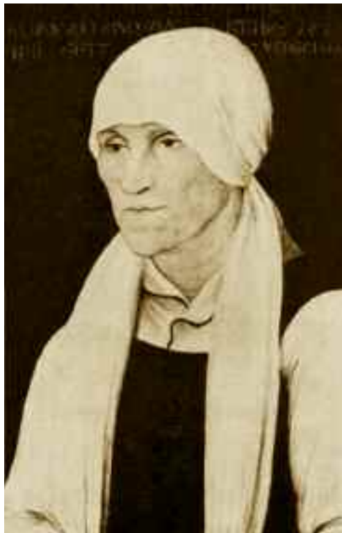
La madre di Martin Lutero.

Queste parole (con le loro innovazioni), che Lutero considerava la consacrazione, quindi le parole essenziali della Messa, corrispondono esattamente a quelle che anche nella "nuova Messa" sono considerate la forma del Sacramento. Le sole parole in più sono quelle del "pro multis", che sono rimaste nel nuovo rito 16 .