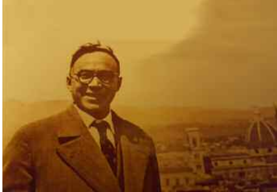
Giorgio La Pira

A questo punto, l'on. Lussu lo richiamò severamente, e La